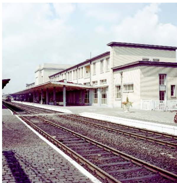
La deuxième gare de Courtrai, vers 1960 (Réf. K00085A)

À l'intérieur également, tout est conçu et exécuté avec le souci du détail. Une œuvre d'art de Rogier Vandeweghe trône dans le hall d'entrée. Elle représente la Lys et les industries de Courtrai. Dans le hall des voyageurs, les