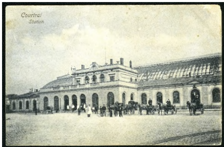
Carte postale de la première gare de Courtrai, vers 1900-1910 (Ref. 10095)