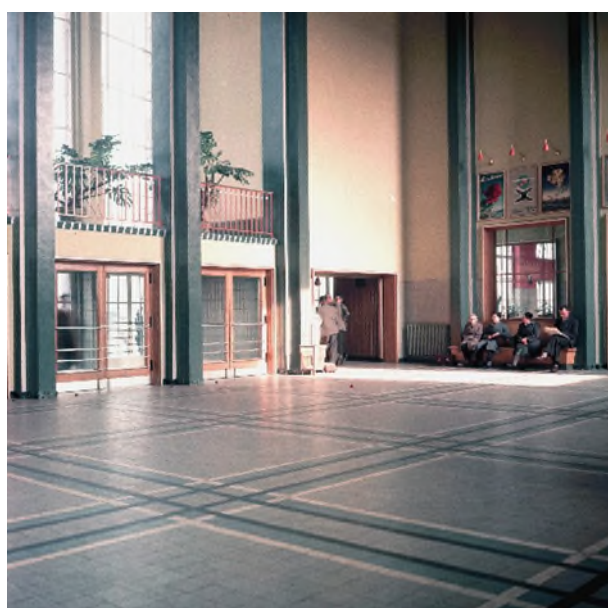
Le hall de gare, vers 1960 (Réf. K00057H)