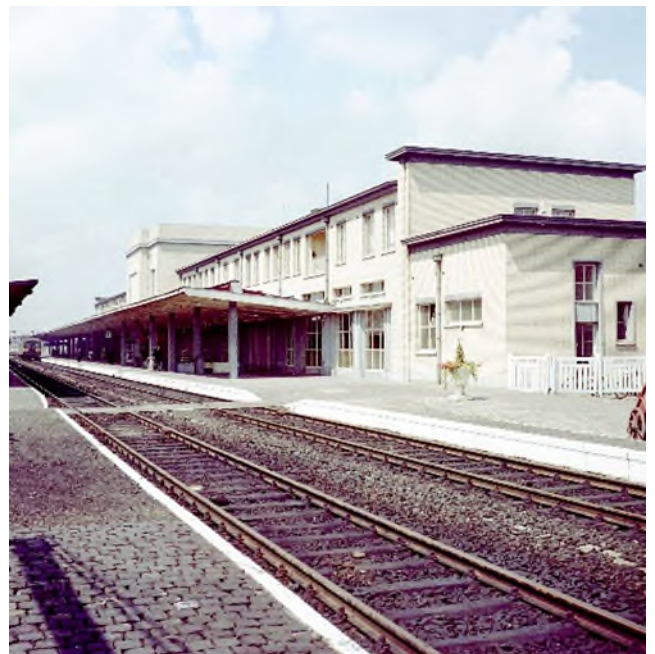
Het tweede station Kortrijk, ca. 1960 (Ref. K00085A)

Ook binnen werd alles met zorg voor detail ontworpen en uitgevoerd. Een kunstwerk van Rogier Vandeweghe siert de inkomhal. Hier wordt de rivier de Leie en Kortrijkse nijverheden afgebeeld. In de reizigershal overheersen frisse kleuren. De vloer