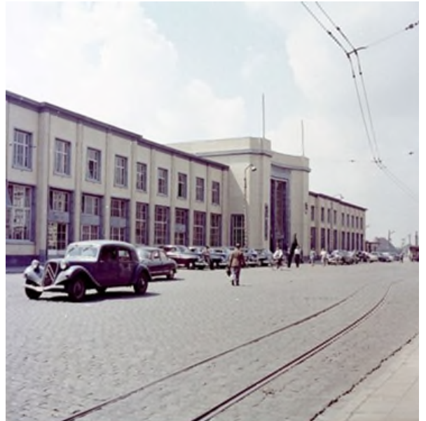
Station Kortrijk, ca. 1960 (Ref. K00085B)