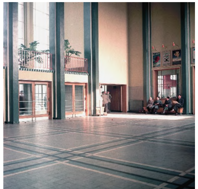
De stationshal, ca. 1960 (Ref. K00057H)