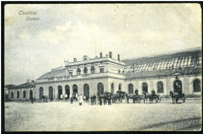
Postkaart van het eerste station Kortrijk, ca. 1900-'10 (Ref. 10095)

geblokte pilasters. De voorgevel werd gekenmerkt door ronde bogen voor deuren en vensters. Een ornament met stationsklok bekroonde het centrale gedeelte.