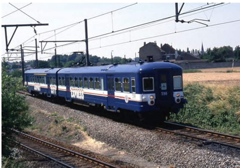
Automotrice 598 à Zaventem, Ronald Mardaga, 18 juin 1987 (réf. M023-048)

Lors de leur mise en service, les automotrices arboraient une caisse de couleur bleu foncé (y compris le toit), pourvue d'une bande blanche large et d'une bande blanche fine, sans indication de la classe ; Les logos de la SABENA et de la SNCB figuraient sous le bord du toit. Après la reprise de ces rames par la SNCB en 1979, le logo SABENA a disparu et la bande jaune de première classe, ainsi que le numéro de la classe, ont fait leur apparition.