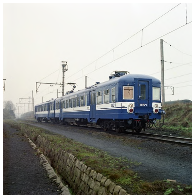
Automotrice 851 portant l'inscription "Sabena", 1970 (réf. K00226C)

En quelques mots : Ces automotrices constituaient la quatrième tranche de la plus grande série de matériel roulant électrique pour voyageurs que la SNCB ait fait construire avec une caisse quasi identique.