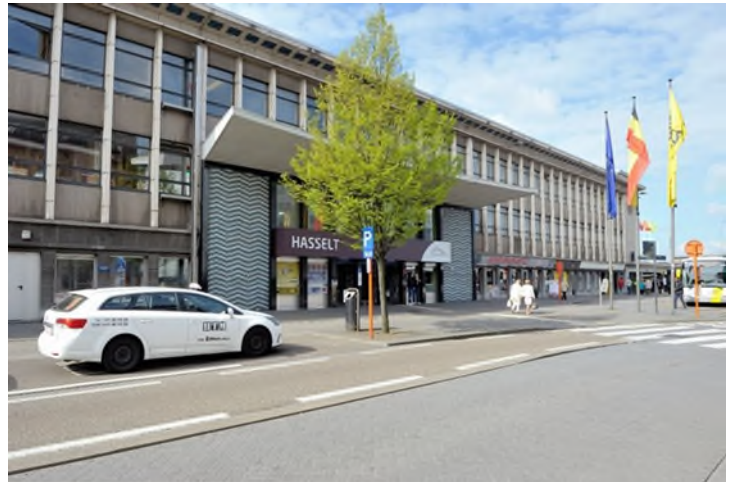
L'entrée de la gare actuelle de Hasselt, Denis Moinil, 19 avril 2016 (Réf. D4151-01)