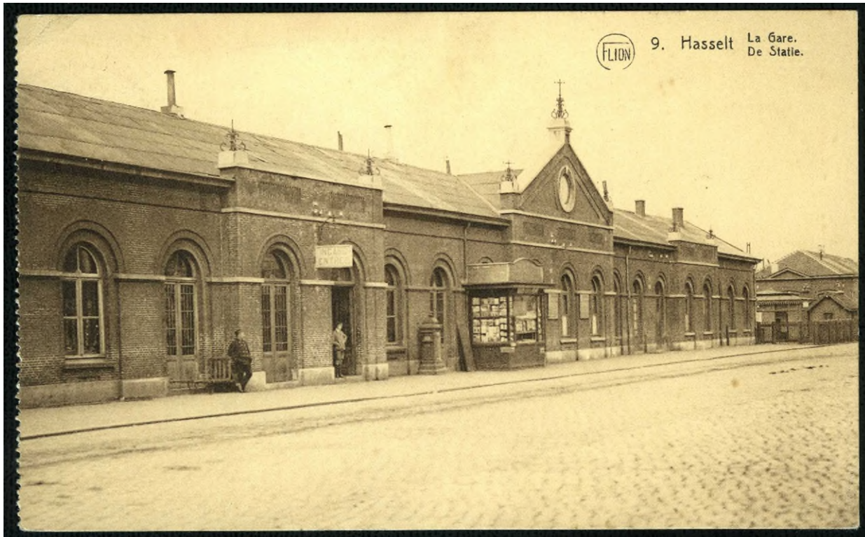
Carte postale de la deuxième gare d'Hasselt (Réf. 10097)

La dernière liaison ferroviaire mise en service le 3 mars 1874 sera la liaison avec Maaseik via Genk (ligne 21A).