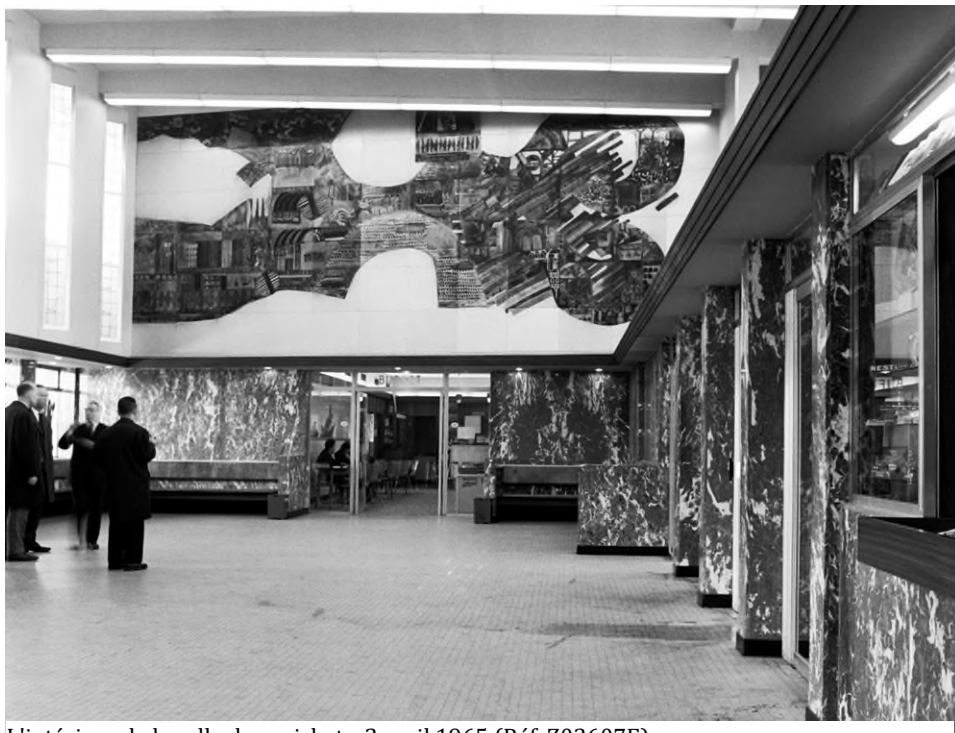
L'intérieur de la salle des guichets, 2 avril 1965 (Réf. Z03607E)

Les travaux de rénovation de la gare vont commencer en juillet 2020. Tant les quais que les escaliers, les escaliers roulants et les ascenseurs sont rénovés. Le calendrier