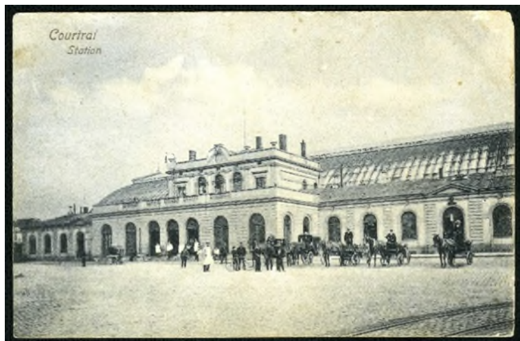
Carte postale de la première gare de Courtrai, vers 1900-1910 (Ref. 10095)