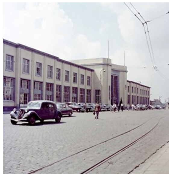
Gare de Courtrai, vers 1960 (Réf. K00085B)