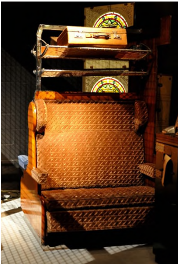
Dubbelzijdige bank met bagagerek van een K 1-rijtuig (Ref. 4798)

In zijn hoedanigheid van adviseur gaf hij zijn mening over de decoratie van het spoorwegmaterieel dat gebouwd werd. Hij zou ook een groot aantal voorwerpen ontwerpen, zoals banken en hang- en sluitwerk, maar ook objecten die dienden als versiering (zoals voor de eerste- en tweedeklasafdelingen van de K 1-rijtuigen van de binnenlandse dienst).