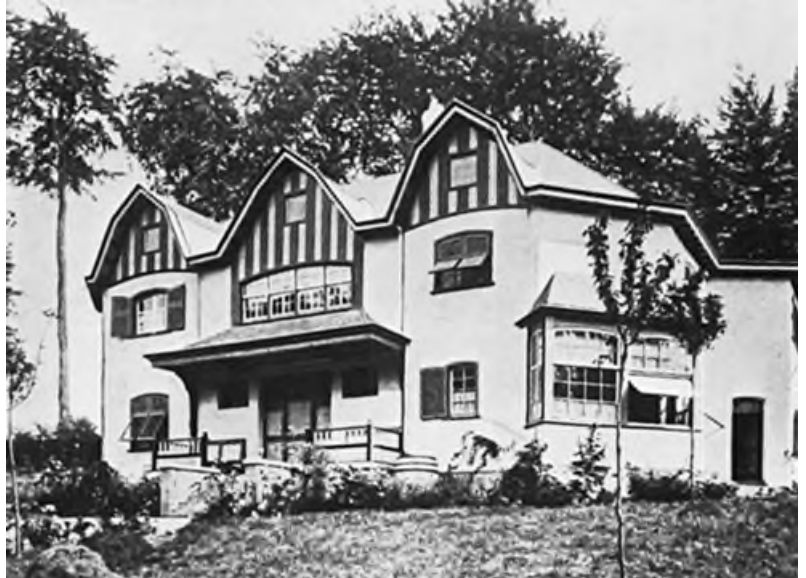
Villa Bloemenwerf in Ukkel - 1896

van de Velde wordt beschouwd als de initiatiefnemer van de Modern Style , de Angelsaksische concurrent van de Art Nouveau. Een stroming die werd gekenmerkt door inventiviteit, met nieuwe materialen en technieken en een abstracte stijl, met de afgeronde lijnen die kenmerkend zijn voor de Art Nouveau.