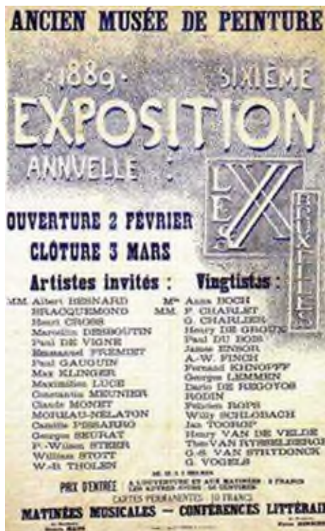
Affiche van een expo van Les XX , 1889

Henry-Clément van de Velde werd op 3 april 1863 in Antwerpen geboren in een burgerlijk gezin. Hij werd al vroeg verleid door literatuur, muziek en schilderkunst.