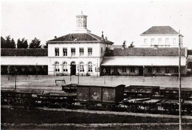
Eerste station Mechelen aan de kant van de sporen (Ref. Z01352A)

Wie de ontwerper was van het eerste station is niet bekend. Sommigen zeggen dat ingenieur De Ridder de ontwerper was, anderen schrijven het ontwerp toe aan ingenieur Poncelet, die de bouwwerken van het station geleid heeft.