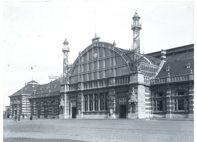
Tweede station Mechelen aan de straatkant (Ref. Z03428A)