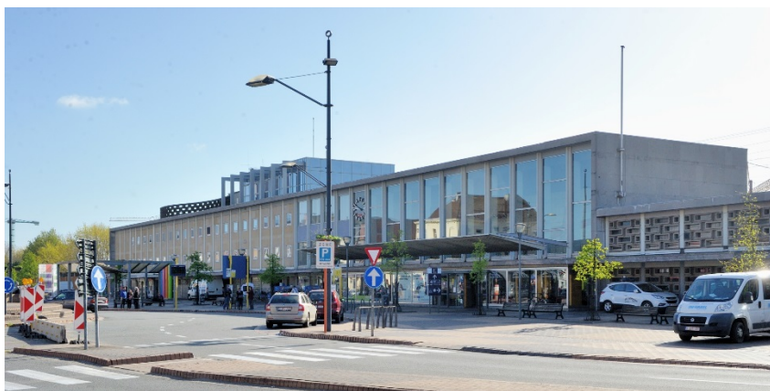
Derde station Mechelen aan de straatkant (Ref. D4152-2)

Doorheen het station werden tien geëlektrificeerde sporen aangelegd, waarvan vier op een verhoogde berm voor de snelle spoorlijn van Brussel naar Antwerpen. Voor de toegang tot de perrons werd een spooronderdoorgang gebouwd voor zowel reizigers als goederen.