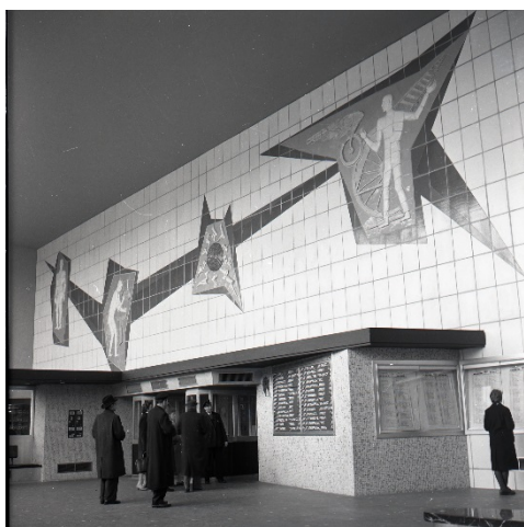
De lokettenzaal met mozaïek van het derde station Mechelen (Ref. Z03544C)

Twee jaar lang werd er gebouwd aan het derde station en de bijhorende aanpassingen, zoals de ophoging van de sporen en de nieuwe overbruggingen van de Leuvense vaart. Op 14 december 1959 werd het station, een modernistisch gebouw ontworpen door architect Van Meerbeeck, plechtig ingehuldigd.