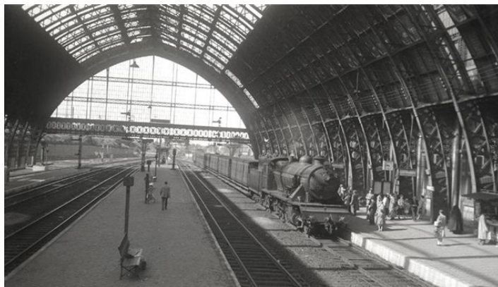
De overkapping van het tweede station Mechelen (Ref. Q0142)

Bij de luchtbombardementen van 1944 werd de glazen overkapping grotendeels vernield.