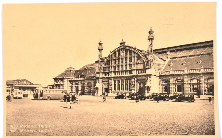
Tweede station Mechelen aan de straatkant (Ref. 10128)

De grondwerken begonnen uiteindelijk op 22 november 1885 en op 14 augustus 1886 was de ruwbouw van het station klaar. Restten nog de 110 meter lange overkapping uit staal en glas over de vijf ontvangstsporen en de afwerking van het stationsgebouw. De werken werden in 1887 even stil gelegd omdat er fouten waren gebeurd in de berekeningen van de stabiliteit van de overkapping. Op 15 mei 1888 werd het station eindelijk in gebruik genomen en werd het oude afgebroken.