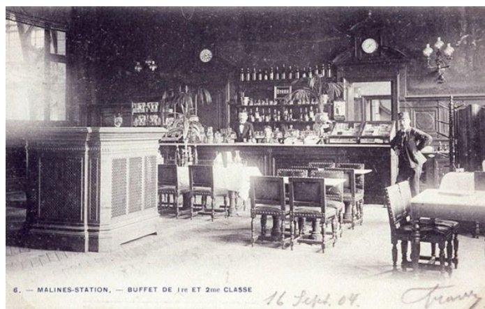
Buffet voor passagiers eerste en tweede klas in het station Mechelen (Ref. Z00260)

Op 30 september 1956 werd het tweede station buiten dienst gesteld en tijdelijk vervangen door een houten noodstation. De afbraak van het gebouw en de koepel voltrok zich in 1957.