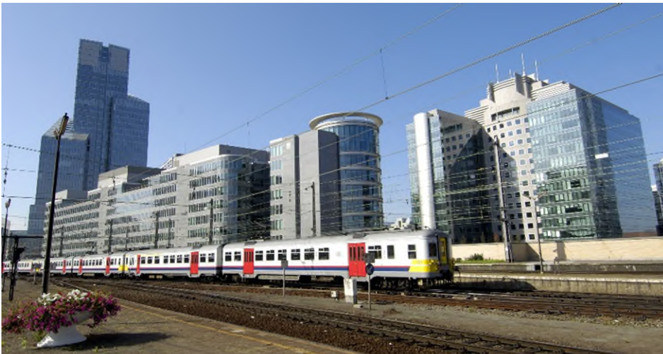
Motorstellen 1966/1970 JH in Brussel-Noord, Denis Moinil, oktober 2006 (Ref. D2859-06)

In 1999 voerde NMBS, naar aanleiding van de modernisering van de tweeledige motorstellen schijven 1966 tot 1979, een nieuwe schildering in. De kast kreeg nu een lichtgrijze kleur, de ingangdeuren werden rood, het dak en de onderkant donkergrijs. Een blauwe en rode smalle band boven de donkergrijze onderkant vervulde deze livrei. De felgele intercirculatiedeuren,