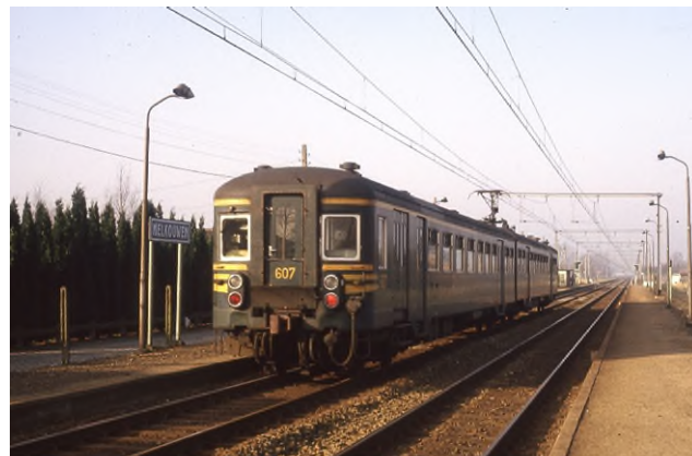
Motorstel 607 in station Melkouxen, Ronald Mardaga, 23 januari 1983 (Ref. M017-021)

In enkele woorden: Deze motorstellen vormden de derde schijf van de grootste reeks elektrisch aangedreven reizigersmaterieel dat NMBS met nagenoeg dezelfde kast liet bouwen.