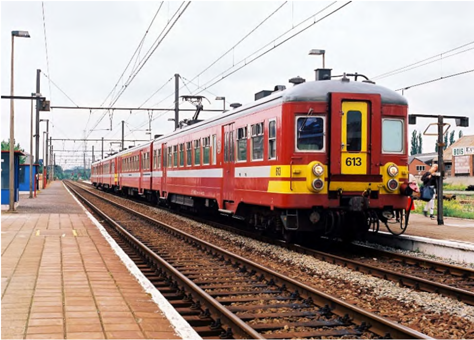
Motorstel 613 in station Fleurus, Denis Moinil, juli 1998 (Ref. K02097h)

In 1985 voerde NMBS een volledig nieuwe livrei in. De kast werd bordeaux met een smalle grijswitte band en donkergrijs dak. De intercirculatiedeuren en de eersteklasband bleven felgeel maar de felgele bredere banden werden herleid van drie tot twee. De klas werd aangeduid met witte stickers waarop donkerrode cijfers de klas aangaven. Later gebeurde dit met witte afwrijfcijfers 1 en 2. De draaistellen waren nog steeds zwart.