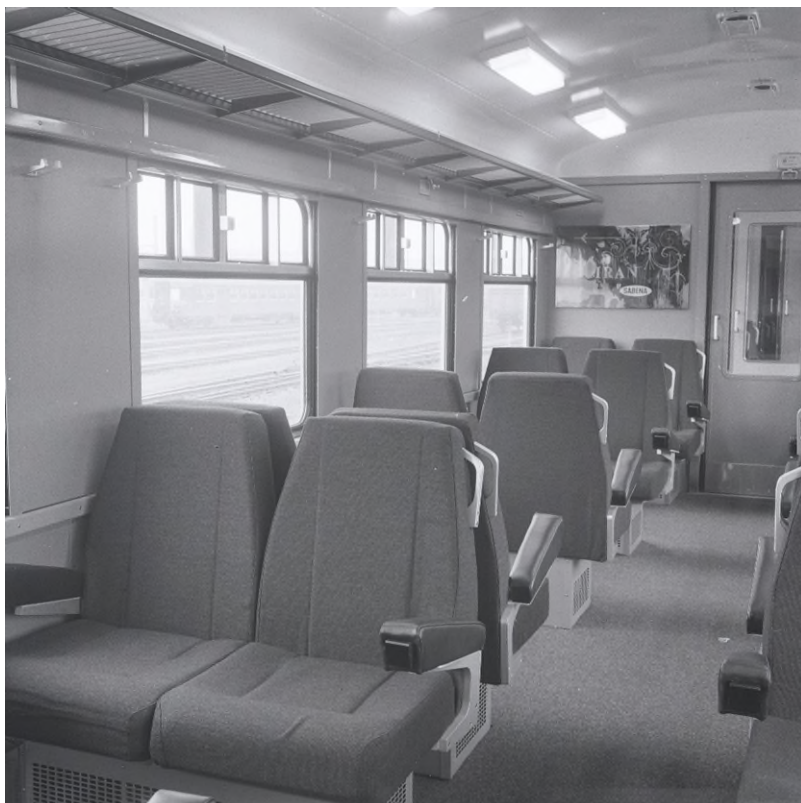
Inrichting van een motorstel 1970 Luchthaven (Ref. Z06453G)

nam ook hun draaisnelheid toe en dus ook de snelheid van het motorstel.