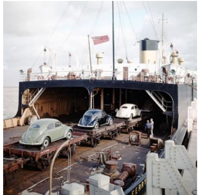
Wagons de marchandises sur un ferry-boat (Réf. K00003B)

En quelques mots : C'est en 1923 que la Société Belgo-Anglaise des ferry-boats est créée pour collaborer au service régulier de transport de marchandises par train-ferry de Zeebrugge à Harwich. Le service sera inauguré l'année d'après.