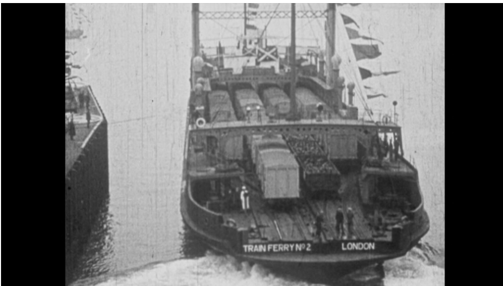
Instantané du film " 50 ans de Ferry-Boats entre Zeebruges et Harwich (Réf. F1008_C10622)

Au début, trois ferries et quelques dizaines de wagons de 12 tonnes rachetés à l'armée britannique vont servir de base à l'exploitation. Sur les ponts des bateaux sont établies quatre voies ferrées qui ont une longueur utile totale de 329 mètres permettant le chargement d'environ 40 wagons de chemin de fer.