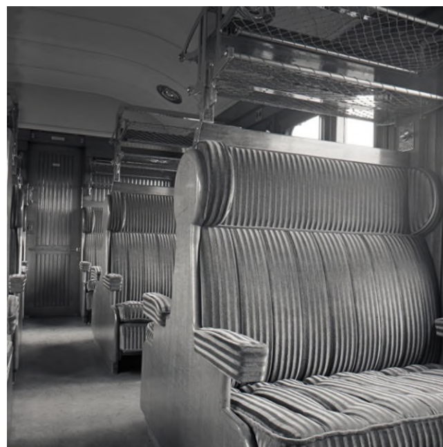
Interieur van een L-rijtuig eerste klas (Ref. Z05994b)

De binneninrichting van de L-rijtuigen kwam tot stand mede door de adviezen van architect Henry Van de Velde, als artistiek adviseur van de NMBS. Alle rijtuigen beschikten bij constructie over stoomverwarming die ze behielden tot bij hun buitendienststelling.