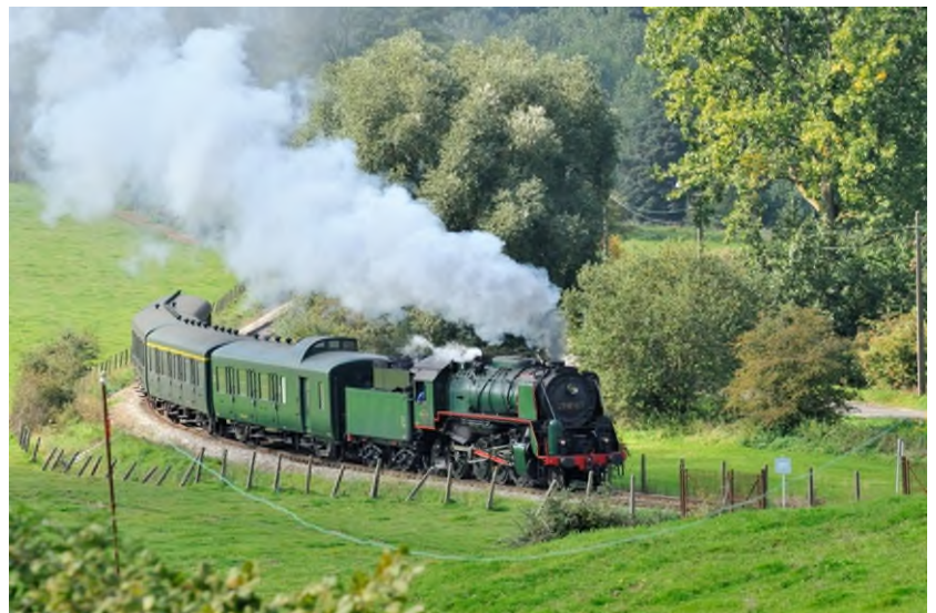
Historische rit met stoomlocomotief 29.013 en vier L-rijtuigen op spoorlijn 115 op 17 september 2010 (Ref. D3518-11)

Heel wat museumverenigingen in binnen- en buitenland kochten L-rijtuigen, maar ze zijn niet allemaal meer in dienst. Onder meer SDP ( Stoomtrein Dendermonde-Puurs ) te Baasrode, CFV3V ( Chemin de fer à vapeur des trois vallées ) te Mariembourg en Train 1900 te Fond-de-Gras (L) zetten nog L-rijtuigen in op hun museumlijnen.