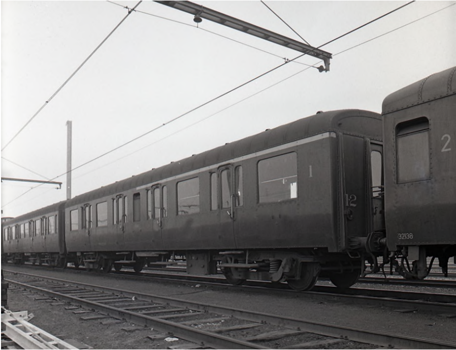
L-rijtuig 50 88 37 26 404-5 na verbouwing tot AB-rijtuig (33004) (Ref. Z05992)

In dezelfde periode werden ook de A-(ex AB-) rijtuigen 31016-31035 tot A4B4-rijtuigen verbouwd. Ook zij behielden de oorspronkelijke AB-indeling zodat zowel de eerste als de tweede klas een afdeling met zijgang had. De zitbanken in tweede klas werden met similieer bekleed. Deze rijtuigen kregen de nummers 33001-33020.