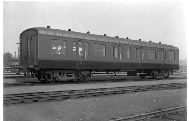
L-rijtuig AB 30.026 in oorspronkelijke toestand (Ref. Z05844)

In enkele woorden: De L-rijtuigen waren reizigersrijtuigen voor de semidirecte binnenlandse dienst. Er werden twee prototypes en 310 reeksrijtuigen gebouwd, de derde grootste reeks metalen rijtuigen die NMBS in de periode 1930-'39 bestelde.