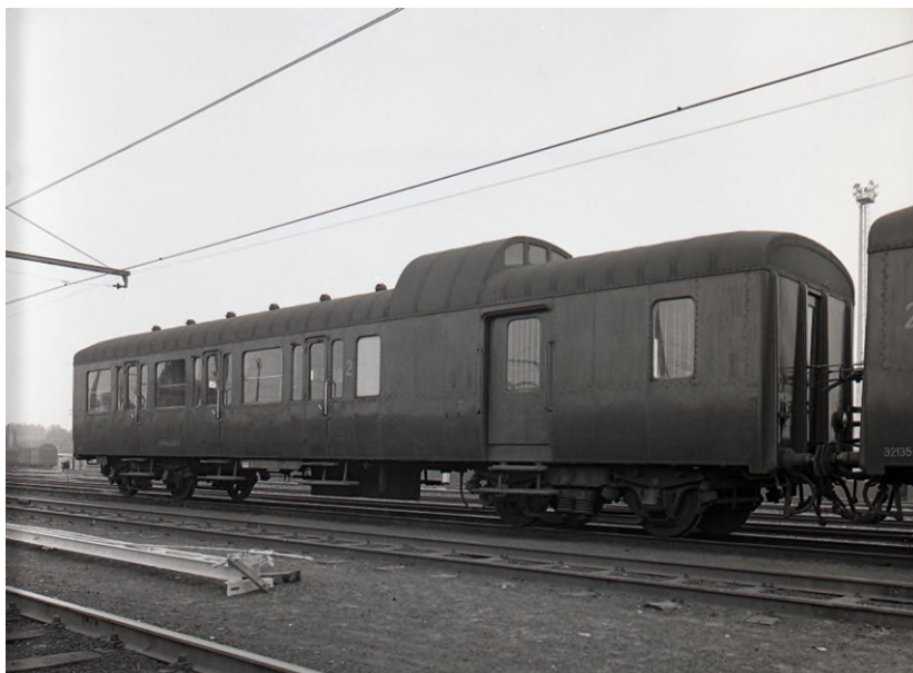
L-rijtuig tweede klas met bagageafdeling (BD) 50 88 82 26 412-2 (39012) (Ref. Z05993)

De AB-rijtuigen hadden een zijgang in eerste en een middengang in tweede klas. Alle andere rijtuigen hadden een middengang.