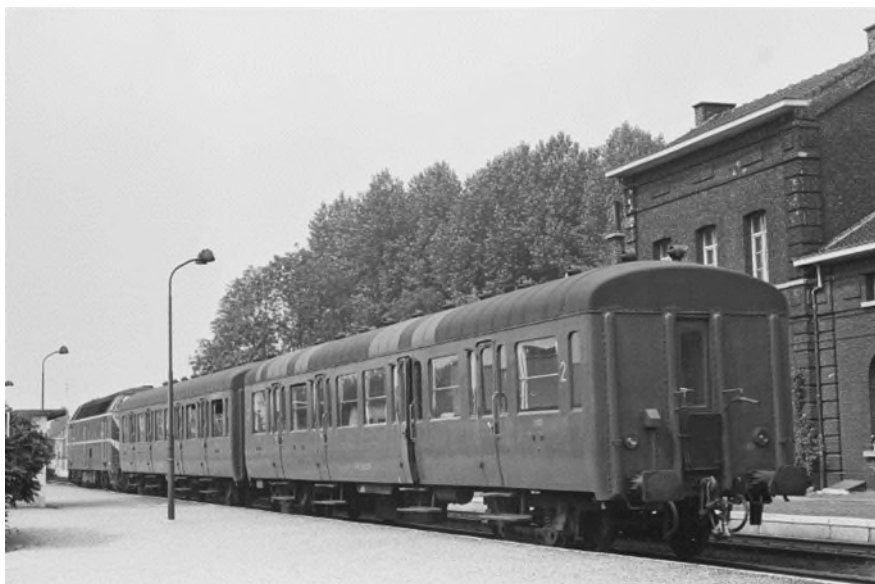
Reizigerstrein met twee L-rijtuigen tweede klas in station Herzele, augustus 1977 (Ref. Z03620c)

Afgezien van de oorlogsprikelen en enkele ongevallen verdwenen ze geleidelijk van de sporen in de periode 1971-2005.