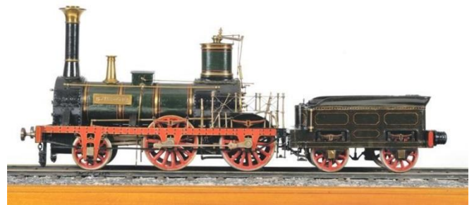
Maquette de la locomotive à vapeur L'Eléphant après modernisation (Réf. 2683)