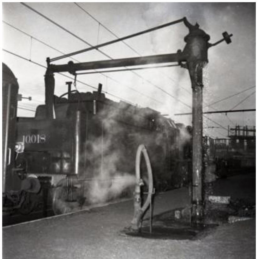
Dernier voyage du type 10 : le tender est rempli d'eau (Réf. Z00514)

Les dernières locomotives seront retirées du service entre les années 1954 et 1959.