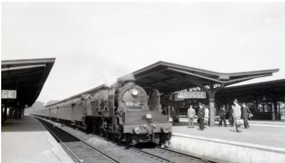
Locomotive à vapeur 10.042 en gare de Bruges, 1953 (Réf. Q0137)

Dès 1912, 14 locomotives seront attachées à Bruxelles-Nord pour le service des liaisons vers Liège et, ultérieurement, vers l'Allemagne pour les lourds trains internationaux. Les autres locomotives sont rattachées à Verviers. Dès juillet 1913, 8 locomotives seront rattachées à Arlon pour prendre la relève des locomotives type 8 sur la ligne du Luxembourg.