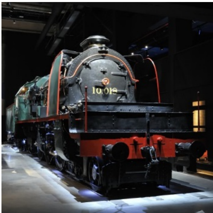
La locomotive 10.018 exposé à Train World (Réf. 2574)

La locomotive 10.018 portait le numéro 4518 aux Chemins de fer de l'Etat belge. Réquisitionnée par l'armée allemande en 1915, elle va servir en zone occupée sous le numéro 05102. Après la guerre, elle revient d'Allemagne et, en 1931, son numéro est modifié en 1018, puis, en 1946, il devient 10.018. Le 29 septembre 1956, cette locomotive va assurer le dernier parcours à vapeur de Luxembourg à Bruxelles et est définitivement mise hors service en 1959 après avoir effectué son dernier voyage le 23 janvier 1959 en tête d'un train Audenarde - Bruxelles-Midi. Elle est ensuite restaurée par l'atelier central de Malines pour rejoindre ensuite le dépôt de musée de Louvain le 26 juin 1979. Elle est aujourd'hui exposée à Train World.