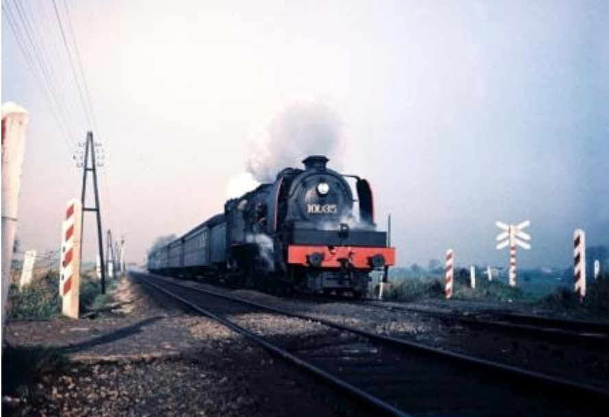
Locomotive à vapeur 10.035 sur la ligne 161 (Ref. K00054B)

La conception de cette nouvelle locomotive était prête fin 1908 et, comme pour les anciens types, les Chemins de fer de l'Etat belge décident de commander quelques prototypes à différents constructeurs belges.