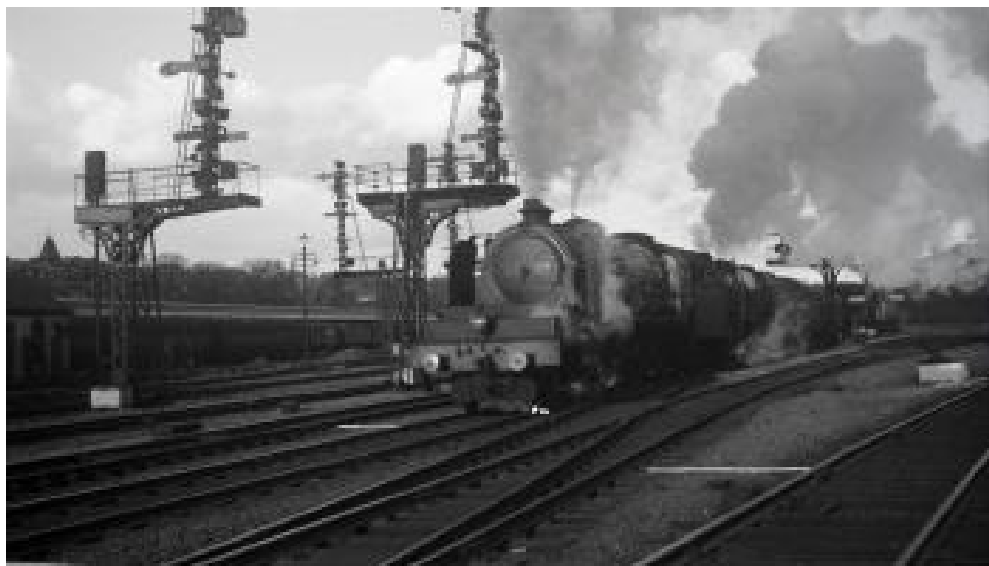
Locomotives à vapeur 1033 et 1016 en gare de Namur, 1938 (Réf. Q0431)

Elles devront cependant attendre avril 1936 pour pouvoir circuler à 120km/h sur la ligne du Luxembourg dont la vitesse de référence n'était auparavant que de 90 km/h.