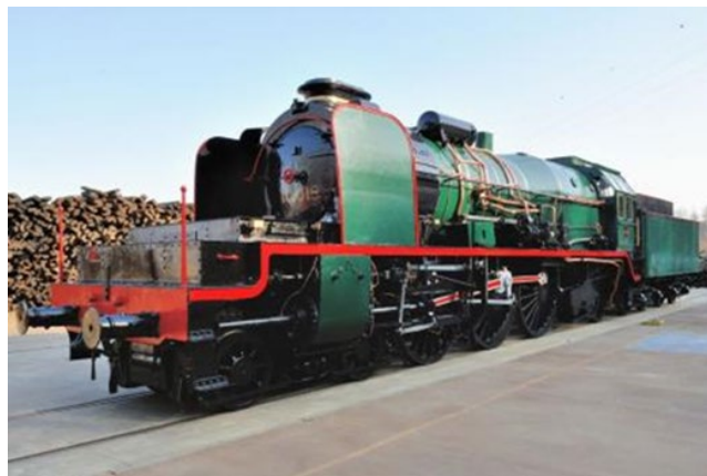
Locomotive à vapeur 10.018 (Réf. D3849-08)