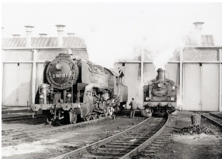
Type 29 à la remise à locomotives de Courtrai (Réf. Z01545)

L'extension des nouveaux modes de traction et la réforme de types anciens qui a suivi vont entraîner leur transfert à Anvers-Dam, Bertrix, Bruxelles-Midi, Courtrai, Herbestal, Kinkempois, Latour, Liège, Louvain, Merelbeke, Monceau, Mons, Saint-Ghislain et Termonde.