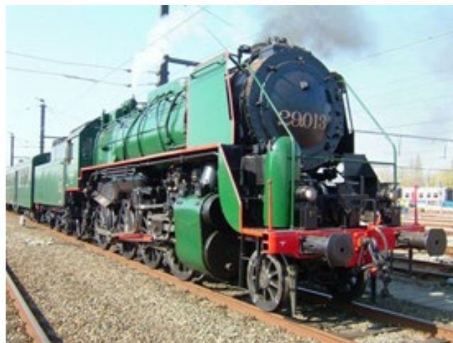
Locomotive à vapeur 29.013 avec tender 25.217 (Réf. 2815)