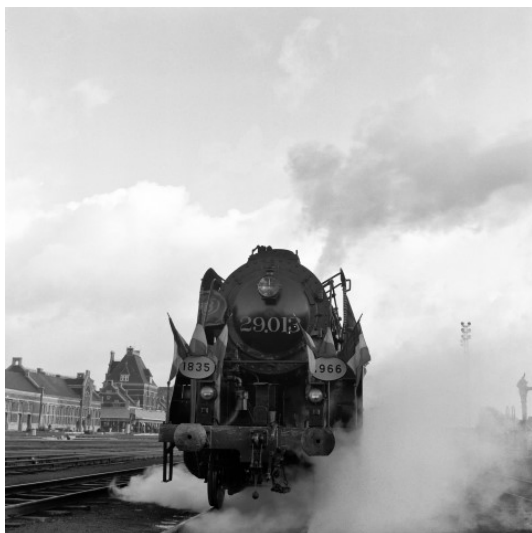
Le dernier train à vapeur pour transport des voyageurs avec la 29.013 (Réf. Z00544)

C'est elle en effet qui effectua le dernier parcours pour voyageur en traction à vapeur, entre Ath et Denderleeuw, le 20 décembre 1966.