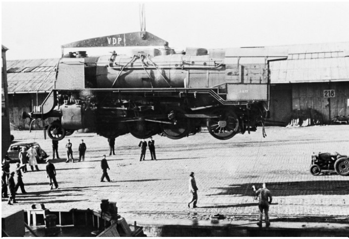
Débarquement d'une locomotive type 29 à Anvers (Réf. Z00668)

Les locomotives américaines de type 140 Consolidation 2 répondent à leurs critères en développant une puissance de 2000 CV et étant aptes à la vitesse de 96 km/h. Il s'agit d'un modèle standard américain adaptable aux conditions de circulation en Belgique.