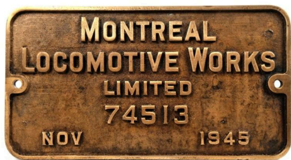
Plaque de constructeur de Montreal Locomotive Works Limited de 1945 (Réf. 2251)

Sur les 300 locomotives produites, seule la 29.013 a été conservée en état de marche. Elle a été construite par la firme canadienne Montreal Locomotive Works.