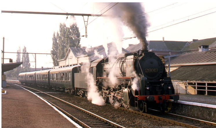
Parcours vapeur historique du 21 septembre 1985 (Réf. M374_068)

Elle circulera encore le 2 septembre 1972 en remorquant un train autour de Bruxelles à l'occasion de l'anniversaire du musée de Schepdaal. En 1976, année du cinquantième anniversaire de la SNCB, la 29.013 remorqua plusieurs trains spéciaux. Par la suite, avec le développement du tourisme ferroviaire, les sorties de la 29.013 sont régulières, et elle deviendra même la star incontournable de bon nombre de manifestations.