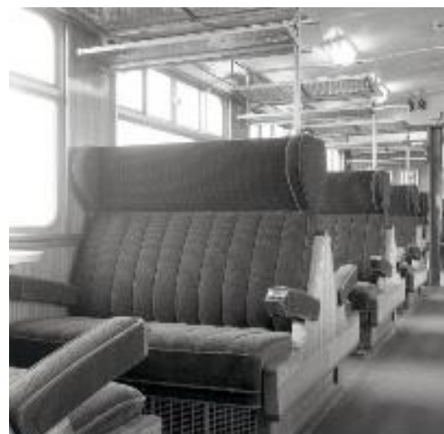
Interieur van een M 2-rijtuig eerste klas (Ref. Z06105E)