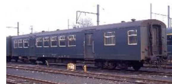
M 2-rijtuig tweede klas met bagageafdeling (Ref. M386_027)