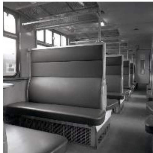
Interieur van een M 2-rijtuig tweede klas (Ref. Z06026A)

De zitbanken waren bekleed met donkerbruin mohair in eerste klas en donkergroen similileder in tweede klas. Vanaf de tweede schijf is het kleurenonderscheid tussen compartimenten voor rokers en niet rokers ingevoerd: groen mohair in eerste en groen similileder in tweede klas voor de rokers; rood mohair in eerste en blauw similileder in tweede klas voor de niet-rokers.