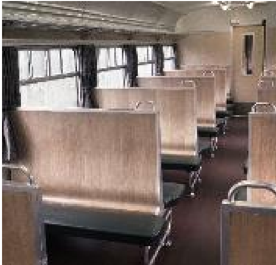
Interieur van een prototype M 2 derde klas (Ref. K00023K)

De bagagerekken werden in de langsrichting opgesteld. De zitbanken waren overtrokken met groen similileder, terwijl de rugleuningen ofwel in limbahout waren uitgevoerd ofwel overtrokken met groen similileder.