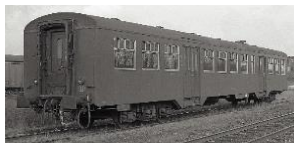
M 2-rijtuig tweede klas (Ref. MZ04675)