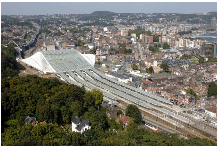
Luchtfoto van het vierde station Luik-Guillemins (Ref. D3194-01)

Voor de gebogen vorm van het station haalde de architect naar verluidt zijn inspiratie uit het lichaam van een op de rug liggende vrouw. De afwezigheid van gevels onderstreept de verbindingsfunctie van het gebouw. Het station wordt gekenmerkt door zijn monumentaal gewelf en bestrijkt drie niveaus. Het luchtige karakter van het gewelf staat in contrast met de intimistische sfeer van de ruimte onder de sporen. De bogen in wit beton creëren een gedempte sfeer die doet denken aan de binnenkant van een grot, waarin veel natuurlijk licht binnenstroomt.