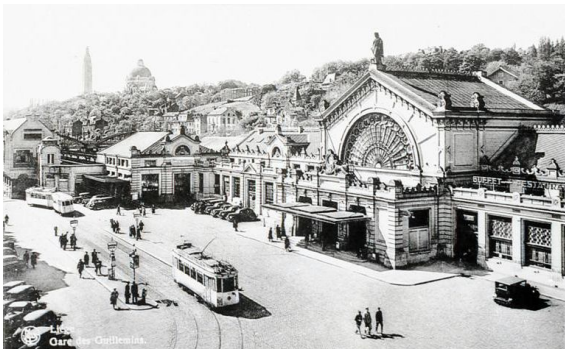
Het tweede station Luik-Guillemins aan de straatkant (Ref. Z00298)

In 1863 beslissen de Luikse autoriteiten om toch een station te behouden in de wijk Guillemins. De spoorwegarchitect A. Lambeau ontwerpt een nieuw monumentaal gebouw ter vervanging van het tijdelijke