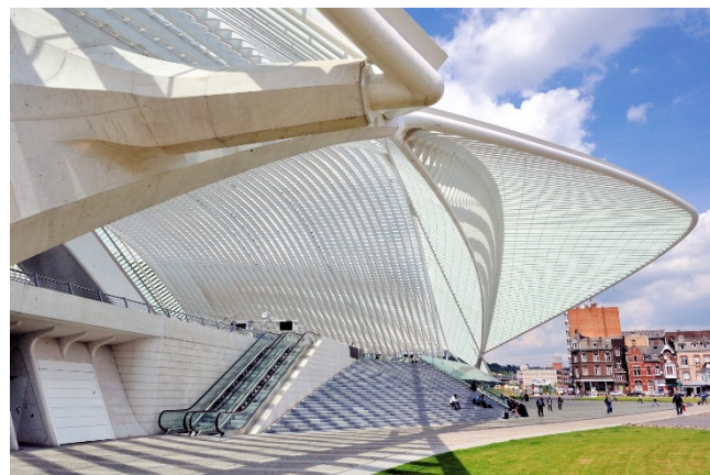
Ingang van het huidige station Luik-Guillemins (Ref. D3487-61)