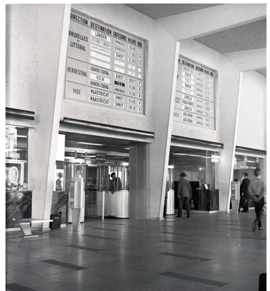
Automatische treinaankondiger in de lokettenzaal van het derde station Luik-Guillemins (Ref. Z03483B)

Het nieuwe station, geïnspireerd op het Stazione Termini in Rome, wordt ontworpen door de groep EGAU. De modernistische architecten opteren voor een geraamte in gewapend beton. Binnen zijn 24 loketten geïnstalleerd die uitkijken op de grote stationshal. Centraal vertrekt een gang die leidt naar de sporen. Boven de doorgang prijkt het allereerste automatische aankondigingsbord van België. Er wordt ook veel aandacht besteed aan de integratie van beeldende kunst met onder andere een glasmaam van Jean Rets, sculpturen van Pol Bury en een schilderij van Georges Collignon. Eind jaren 1980, begin jaren 1990, ondergaat het gebouw een aantal veranderingen om winkelruimtes en een comfortabeler travelcenter te creëren.