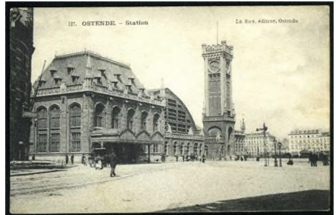
Postkaart van station Oostende-Stad, ca. 1905 (Ref. 10093)