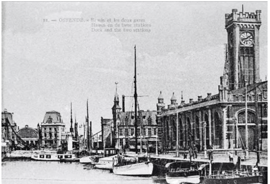
Postkaart met vooraan het station Oostende-Stad en in de achtergrond het station Oostende-Kaai (Ref. Z00968)

Dit station moest, evenals het station Oostende-Kaai, de allure van een badplaats uitstralen waardoor er ook extra aandacht besteed werd aan de ontvangst van de reizigers. Zo werd er in de aankomsthal plaats voorzien waar rijtuigen en hotelkoetsen de aankomende reizigers direct konden oppikken. In deze aankomsthal kwamen ook de hotelvertegenwoordigers om hun hotel met luid geroep aan de reizigers aan te prijzen.