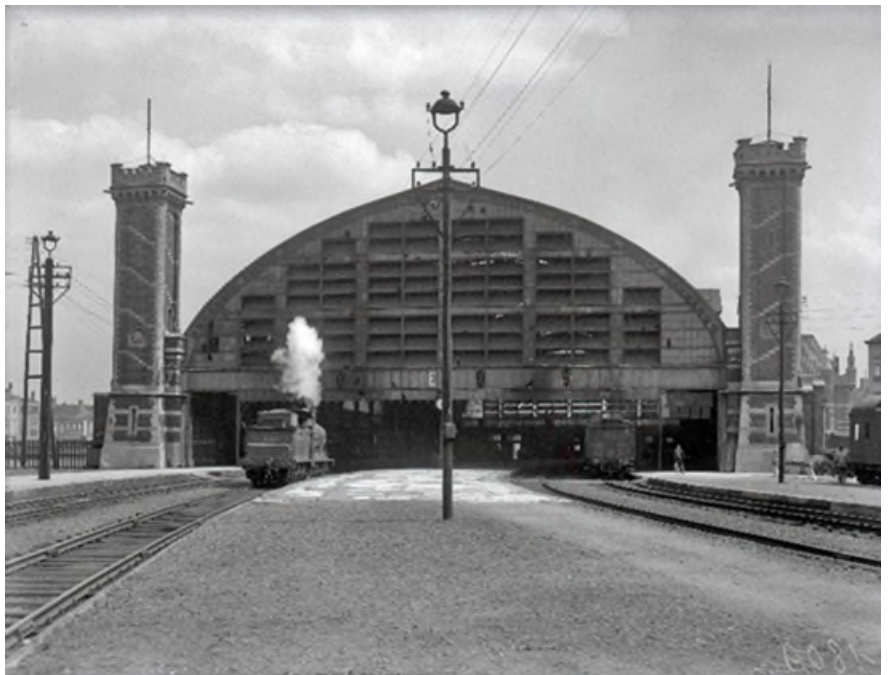
De sporenhal van station Oostende-Stad, jaren 1930 (Ref. Z02988B)

In 1903 werd het verbindingsspoor tussen de stations Oostende-Stad en Oostende-Kaai buiten dienst gesteld en uitgebrouwen. Nadat de binnenlandse treinen tussen Brugge en Oostende al in oktober 1935 overgebracht waren naar het station Oostende-Kaai waren het nog enkel de lokale treinen van de lijn naar Torhout die er aankwamen en vertrokken.