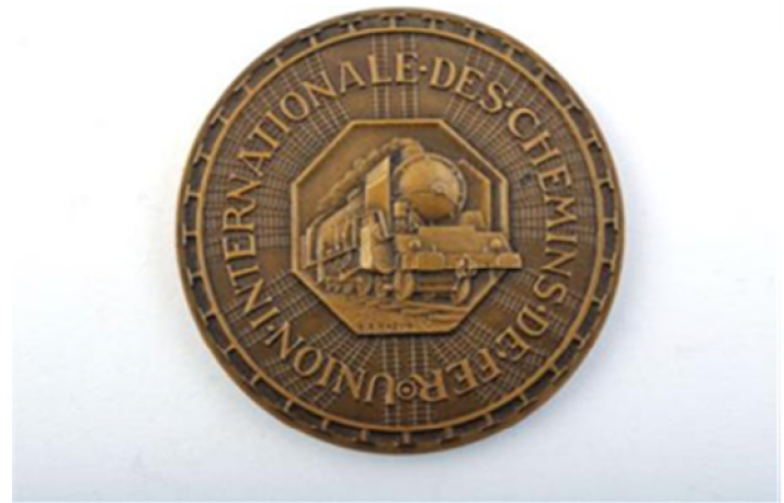
Médaille de l'Union internationale de chemins de fer en l'honneur de sa 7ème assemblée générale en 1948 (Réf 3639)