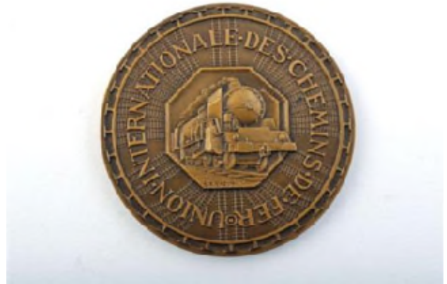
Medaille van de Internationale Spoorwegunie ter ere van de zevende algemene vergadering in 1948 (Ref. 3639)