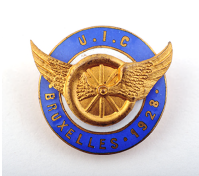
Aandenken aan het congres van de Internationale Spoorwegunie (UIC) te Brussel in 1928 (Ref. 4264)

De internationale conferentie tot oprichting van de Union Internationale des Chemins de fer (Internationale Spoorwegunie, UIC) werd op 17 oktober 1922 in Parijs gehouden.