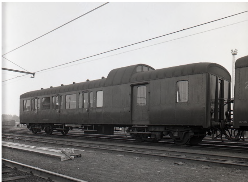
Voiture L de deuxième classe avec compartiment à bagages (BD) 50 88 82 26 412-2 (39012) (Réf. Z05993)

Les voitures AB disposaient d'un couloir latéral en première classe et d'un couloir central en deuxième classe. Toutes les autres voitures étaient munies d'un couloir central.