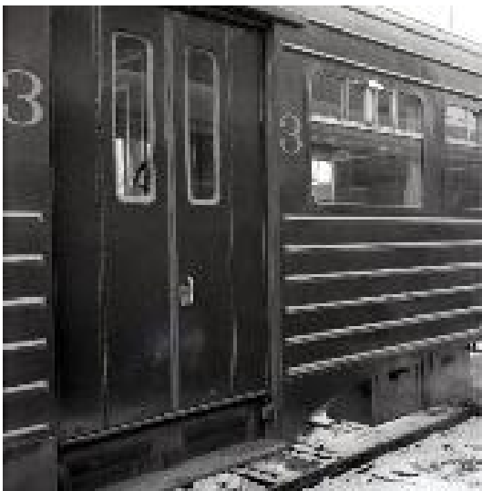
Parois latérales et portes du prototype M 2 de 3 e classe (Réf. Z06130A)

En 1954, avant d'entamer la construction de voitures de type M 2, la SNCB a construit en ses propres ateliers quatre prototypes de 3 e classe (C) comportant 114 places assises. Ils portaient les numéros 63301 à 63304. Lors de la suppression de la 1 re classe en 1956, deux prototypes ont été renumérotés en 1957 en tant que voitures de 2 e classe (42251 en 42252).