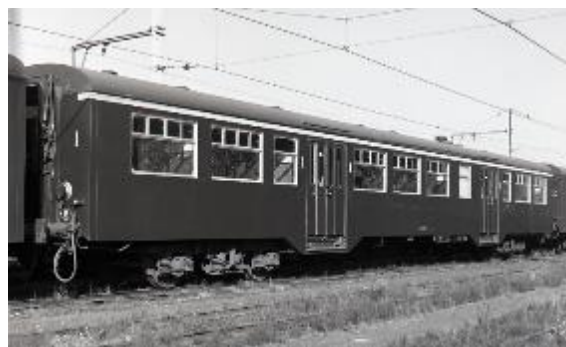
Voiture M 2 de 1 re classe (Réf. Z05929)

En quelques mots : Les voitures M 2 sont des voitures à voyageurs destinées au trafic intérieur régional de la SNCB. Elles ont été construites en 620 exemplaires, ce qui constitue la plus grande série de voitures commandées par la SNCB.