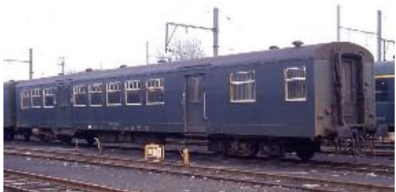
Voiture M 2 de 2 e classe avec compartiment à bagages (Réf. M386_027)