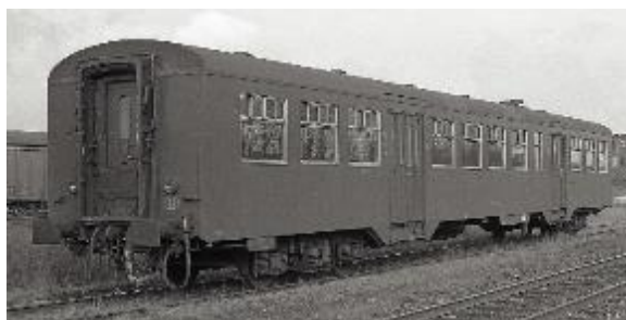
Voiture M 2 de 2 e classe (Réf. MZ04675)