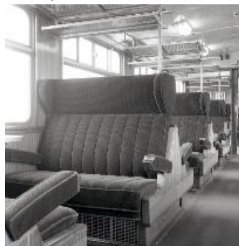
Intérieur d'une voiture M 2 de 1 re classe (Réf. Z06105E)