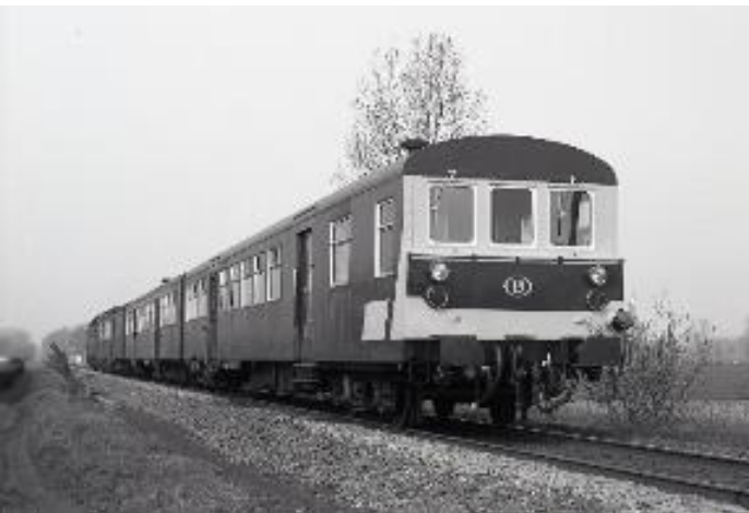
Voiture M 2 avec poste de conduite pour la traction diesel (Réf. Z07861B)

Afin de pouvoir remplacer les trains réversibles à traction diesel, composé des voitures M 1 d'avant-guerre, quelques voitures AB, B et BD ont été adaptées dans la période 1978-1990.