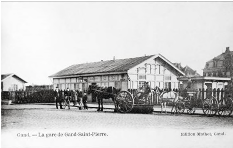
De houten spoorweghalte Gent-Sint-Pieters (Ref. Z04210)

In 1901 werd een grootscheeps onteigeningsplan opgesteld, zodat een volwaardig station de kleine halte zou kunnen vervangen. Het duurde tot 1905 voor deze plannen concreet werden. Een van de slachtoffers van die onteigening was de toen nog jonge voetbalclub La Gantoise, nu KAA Gent. Het project kwam in een stroomversnelling door de plannen voor een Wereldtentoonstelling in 1913. De stad wou een prestigieus station in de nabijheid van de tentoonstellingsterreinen.