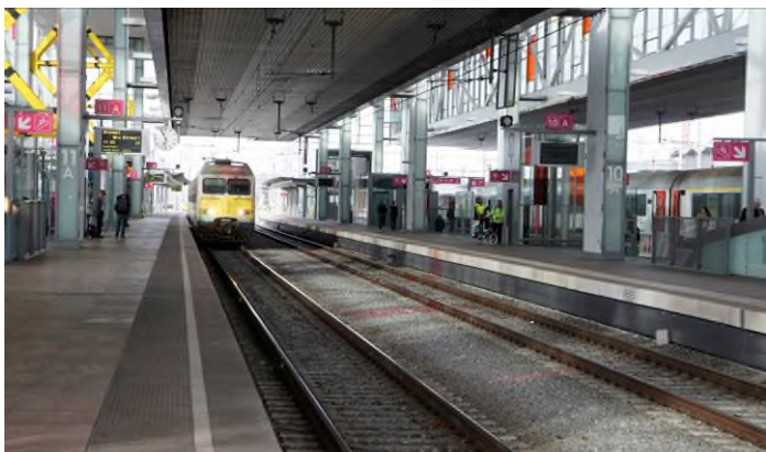
De nieuwe perrons (Ref. A0233_21)

Eind november 2007 werden het postgebouw Gent X en de oude goederenloods naast het postgebouw afgebroken om plaats te maken voor het nieuwe bus- en tramstation. Onder de sporen werden twee tunnels gegraven: de Timechegtunnel als toegang tot de nieuwe ondergrondse parking aan de Sint-Denijslaan en een tijdelijke tramtunnel met een 106 meter lange fotowand van de Zwitserse kunstenaar Beat Streuli. Voor de aanleg van de nieuwe ondergrondse parkeergarage langs de Fabiolalaan diende 470.000 m 3 grond te worden uitgegraven. Eind 2010 opende het eerste deel van de drie verdiepingen tellende ondergrondse parking haar deuren. Met plaats voor 2.700 wagens is dit de grootste ondergrondse parkeergarage van België.