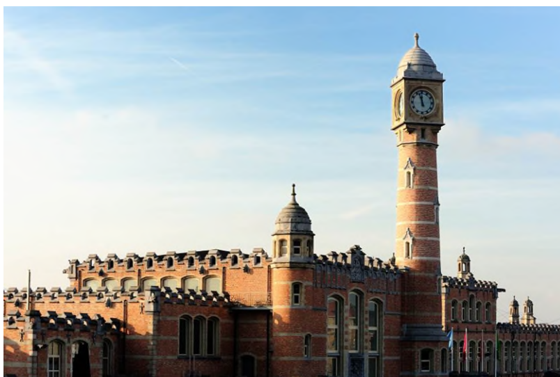
Station Gent-Sint-Pieters (Ref. L3502-34)