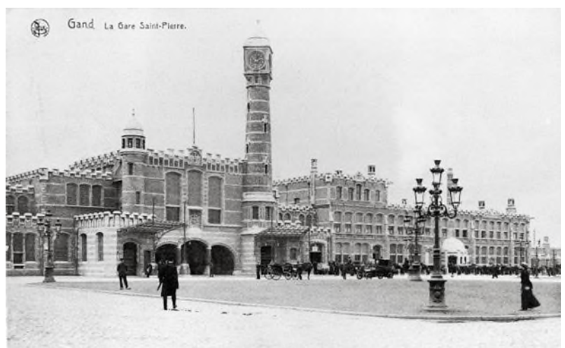
Het tweede station aan de straatkant (Ref. Z04214)

Met de organisatie van de Wereldtentoonstelling en de inplanting van het Sint-Pietersstation onderging de wijk een volledige gedaanteverwisseling. Er werden nieuwe lanen aangelegd, prachtige art nouveau-huizen gebouwd en een prestigieus hotel geopend aan het station.