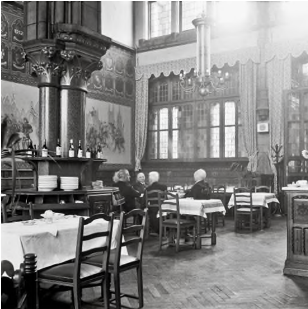
Het stationsbuffet in het tweede station (Ref. Z11081)

De linker 'kloostergang' leidde naar de wachtzalen tweede en derde klas, de rechter naar de wachtzaal eerste klas. In de wachtzalen werden op de muren spoorwegkaarten geschilderd met daarop de steden die bij de bouw van het station in 1913 met de trein bereikbaar waren. Deze originele kaarten werden echter in de jaren 1970 overschilderd door moderne taferelen uit de Gentse geschiedenis.