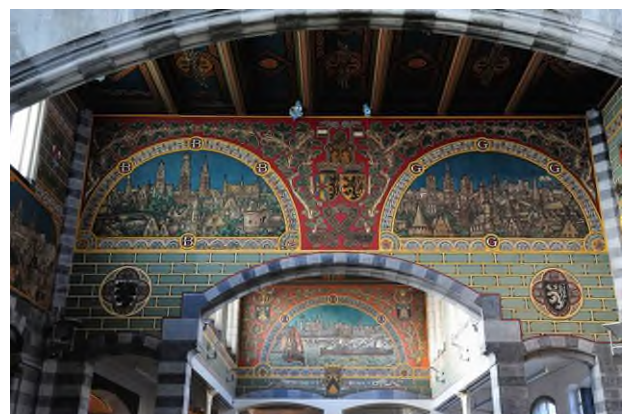
De muurschilderingen na renovatie (Ref. L3502-30)

Ook de kleurrijke muur- en plafondschilderingen in de stationshal, aangetast door vocht en vervuiling, werden tussen 2007 en 2010 grondig gerestaureerd.