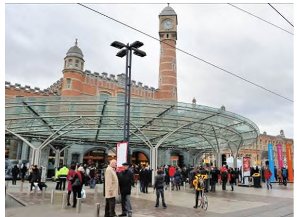
De nieuwe luifel (Ref. D3806-43)

Sinds 1995 is het stationsgebouw van Gent-Sint-Pieters een beschermd monument. In 1997 lanceerde NMBS een plan voor een grondige renovatie. De uurwerktoren, die zwaar was aangetast en scheef stond, werd in 2006 volledig afgebroken en steen voor steen weer opgebouwd met nieuwe bakstenen. Daarna was de luifel boven de ingang van het station aan de beurt. De massieve, donkere stalen luifel uit 1931 verkeerde in slechte staat en werd in het voorjaar van 2008 vervangen door een nieuwe, glazen constructie.