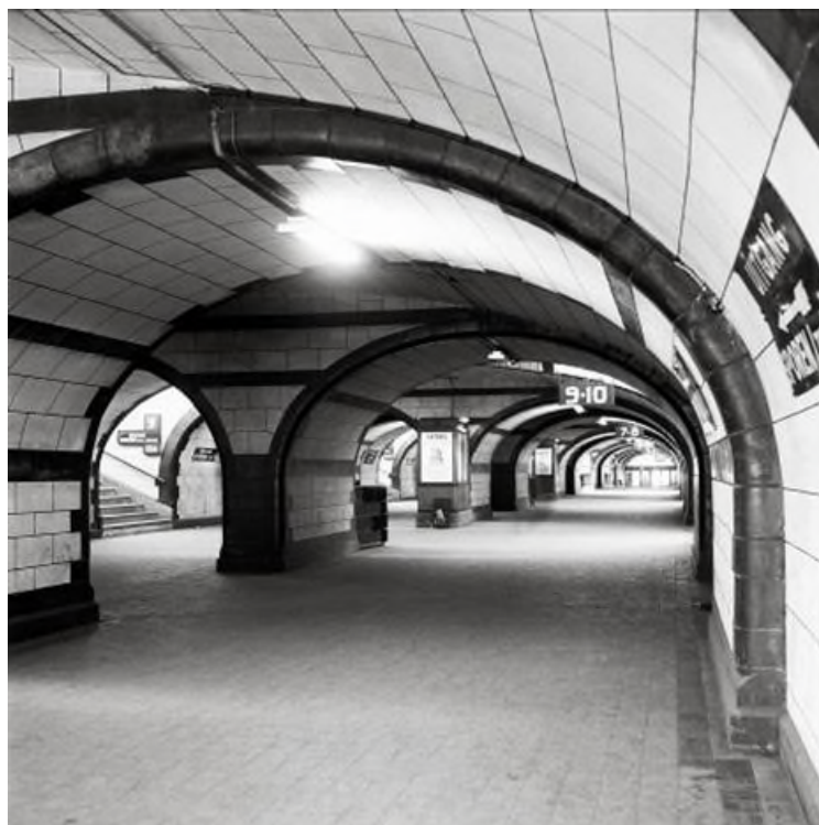
Onderdoorgang van het tweede station (Ref. Z11080C)

draaiend wiel. Elk driehoekig segment werd beschilderd met als hoofdmotief het gevleugeld wiel, dat symbool staat voor de Belgische spoorwegen. In de centrale achthoek is dit symbool omgeven door