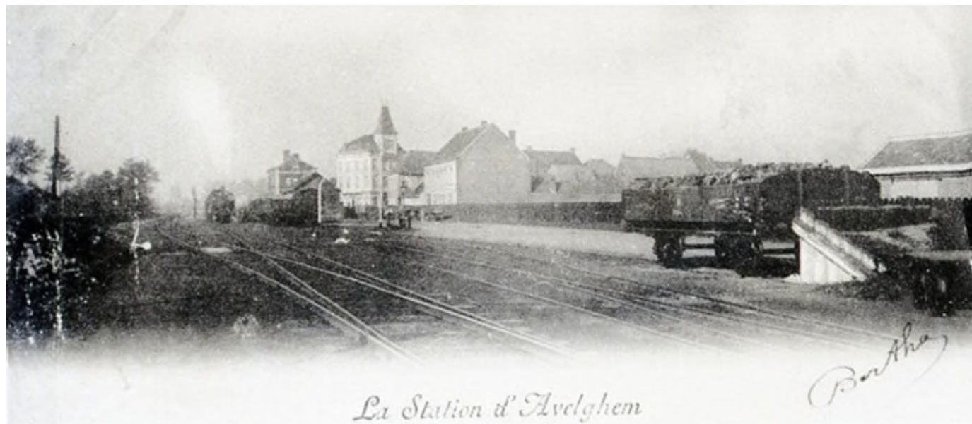
Postkaart van het eerste station Avelgem (Ref. Z00204)

Het bakstenen gebouw met hoekpilasters was een standaardtype station dat gebruikt werd door de spoorwegmaatschappij Braine-le-Comte à Courtrai .