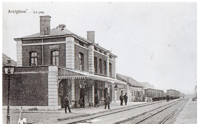
Postkaart van het eerste station Avelgem (Ref. Z01835)