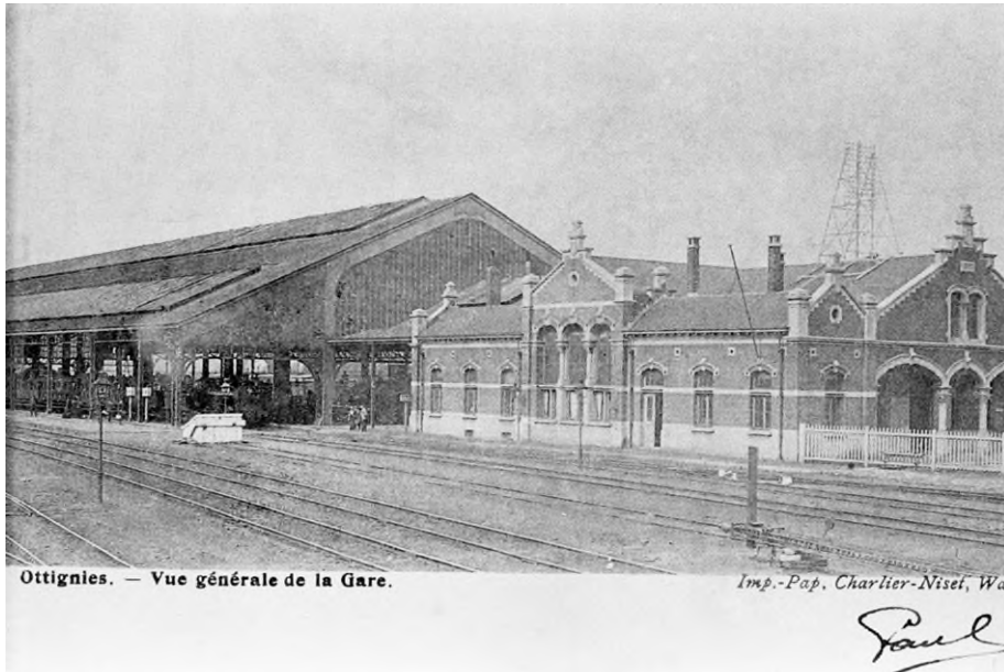
Postkaart van het tweede station Ottignies met sporenhal, gefotografeerd langs de linkerzijde (Ref. Z01172)

In 1884 werd dan een stenen station gebouwd. De architect was Charles Licot (1843-1903), Door de samenkomst van verschillende spoorlijnen ontwierp de architect een 'eilandstation' waar langs de ene zijde de lijn van Leuven naar Charleroi-West lag en langs de andere kant de spoorlijn van Brussel naar Luxemburg via Namen en Aarlen.