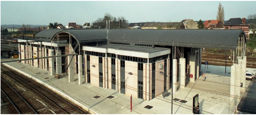
Het derde station Ottignies, Denis Moinil, april 1999 (Ref. D0793-18)

In Ottignies kruisen de spoorlijnen Brussel – Luxemburg en Charleroi – Wavre – Leuven elkaar. Ook de reizigers van Louvain-la-Neuve stappen hier over.