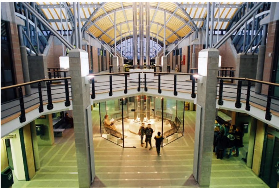
De grote hal in het station Ottignies, Denis Moinil, maart 1999 (Ref. D0762-06)

Het gebouw omvat drie verdiepingen. Het is ontworpen in postmoderne stijl en bestaat uit een tweekleurig betonnen gebouw in de vorm van een kruis met grote erkers. Gebaseerd op het principe van de symmetrie, bieden de gevels een evenwichtige afwisseling tussen volle oppervlakken en grote glasramen die het licht binnenlaten tot in het hart van het gebouw. De ruimten zijn op een zodanige manier ontworpen dat ze een gezellige sfeer uitademen waar de reizigers ten volle van kunnen genieten.