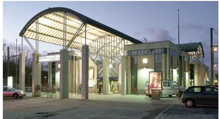
Het huidige station Ottignies, Denis Moinil, december 1999, (Ref. D1193-09a)