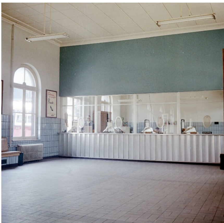
De lokettenzaal in het tweede station Hasselt, 1957 (Ref. K00073A)

Het was een langgerekt rechthoekig gebouw. Op de benedenverdieping werden er rondbogen gebouwd die afgewerkt werden met een arduinen kordon ter hoogte van de aanzet van de boog.