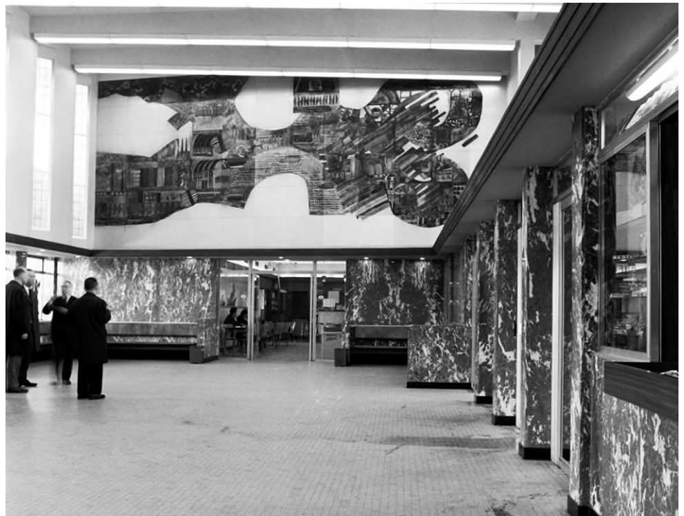
Het interieur van de lokettenzaal, 2 april 1965 (Ref. Z03607E)