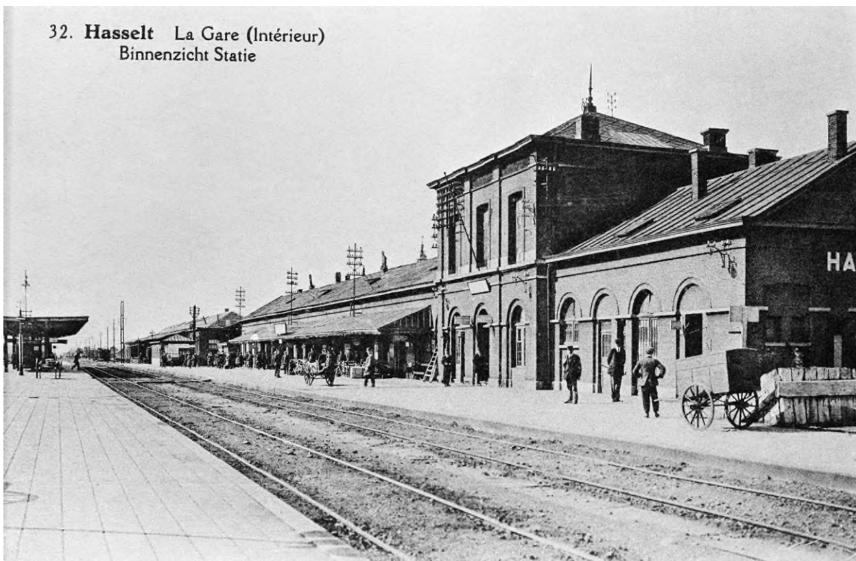
32. Hasselt La Gare (Intérieur) Binnenzicht Statie

Men was in 1863 ook begonnen met de bouw van de spoorlijn naar Antwerpen via Diest en Aarschot (lijn 35), waardoor er een duidelijke nood was om een station te bouwen dat meer centraal gelegen was, dicht bij de stadskern.