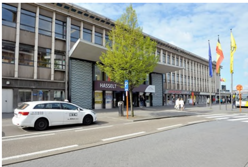
De ingang van het huidige station Hasselt, Denis Moinil, 19 april 2016 (Ref. D4151-01)