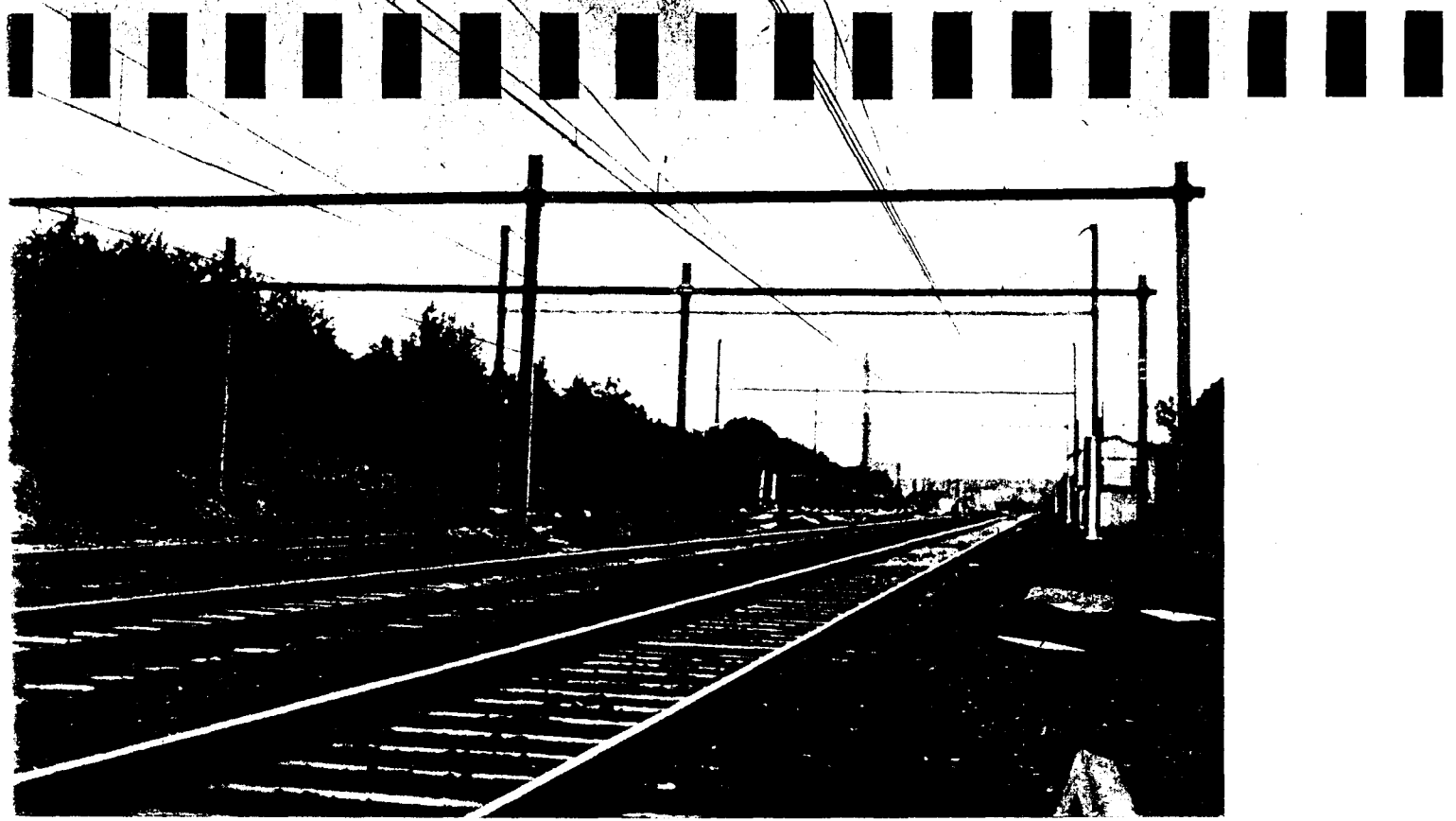
Portiques provisoires pour passage supérieur à Lembeek.