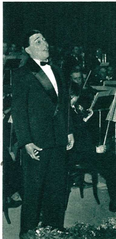
M. Fr. Miche.

Het welslagen van deze campagne is aan hen te danken en hiervoor komt hun de erkentelijkheid van de Maatschappij en mijn persoonlijke dankbaarheid toe.