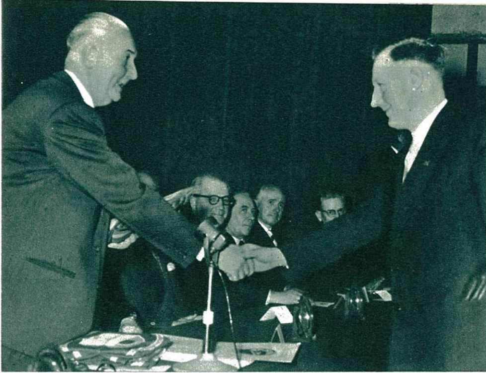
De gelukwensen van dhr. Directeur-Generaal.

de beheerders-afgevaardigden van het personeel-, van hoge ambtenaren van de Maatschappij, van afgevaardigden der erkende personeelsgroeperingen bij de Natio-