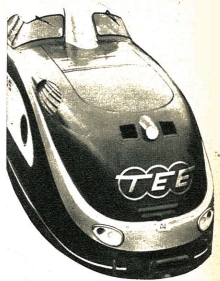
Beheer. — Nederlandse Spoorwegen.

Organisatie. — De groepering T.E.E. treft alle passende maatregelen om aan haar diensten een eenvormig karakter te geven en om rekening te houden met de door de andere vervoermiddelen verwezenlijkte vooruitgang.