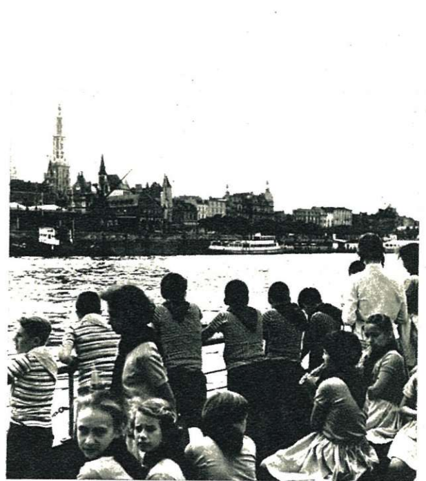
Dobberend op de Schelde...