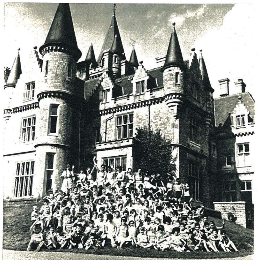
De volledige groep voor het kasteel van Noisy.