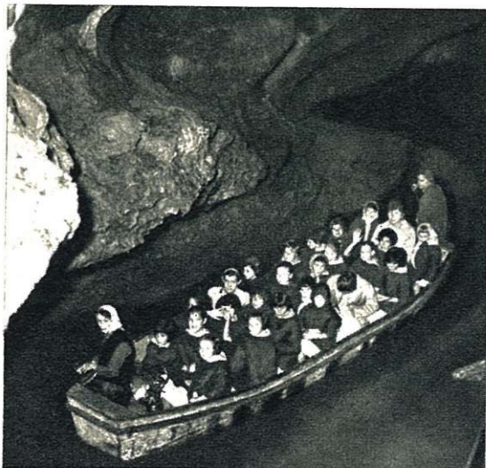
In de grotten van Remouchamps.