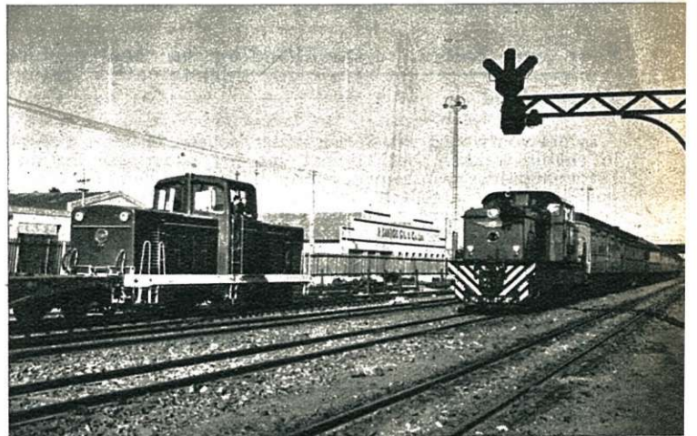
Diesel-hydraulische baan- en rangeerlocomotieven.

Het verkeer tussen de verschillende omschrijvingen geschiedt per boot, per vrachtwagen en per vliegtuig.