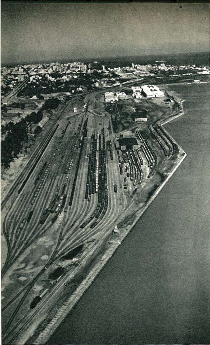
Het nieuw automatisch trierstation van Lourenço Marques.