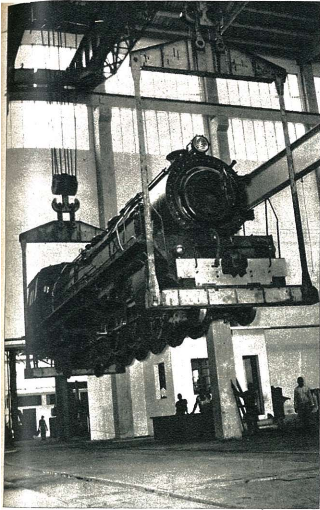
Locomotievendepot te Lourenço Marques.