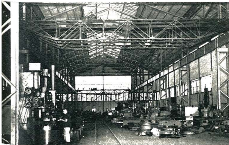
Werkplaatsen te Lourenço Marques.

De spoorwegtractie wordt verzekerd door stoommachines en, sedert twee jaar, door diesel-hydraulische locomotieven.