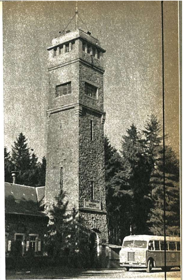
Hoogste punt van het wegennet : Signaal van Botrange (694 m).