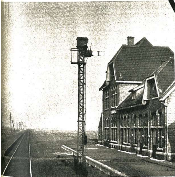
Laagste goederenstation : Oostkerke, op de lijn 74. Hoogtepeil van het spoor : 2,49 m.