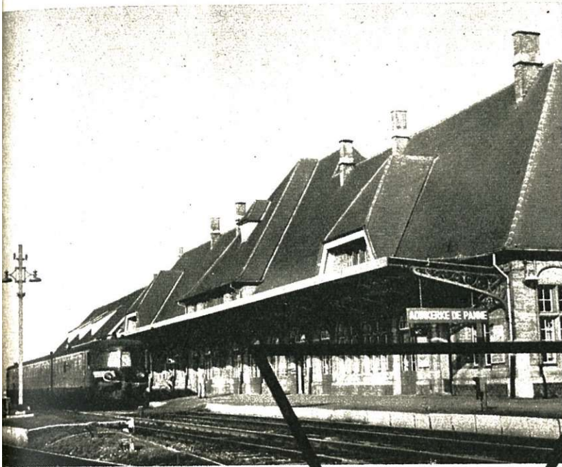
Laagste reizigersstation : Adinkerke-De Panne, op de lijn 73. Hoogtepeil van het spoor : 3,41 m.