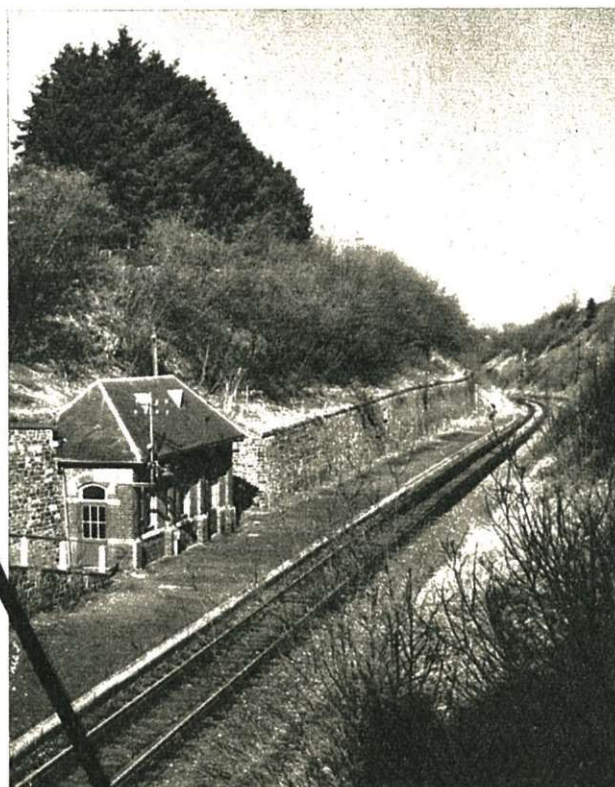
Hoogste reizigerstation : Hockai, op de lijn 44 a. Hoogtepeil van het spoor : 538,575 m.