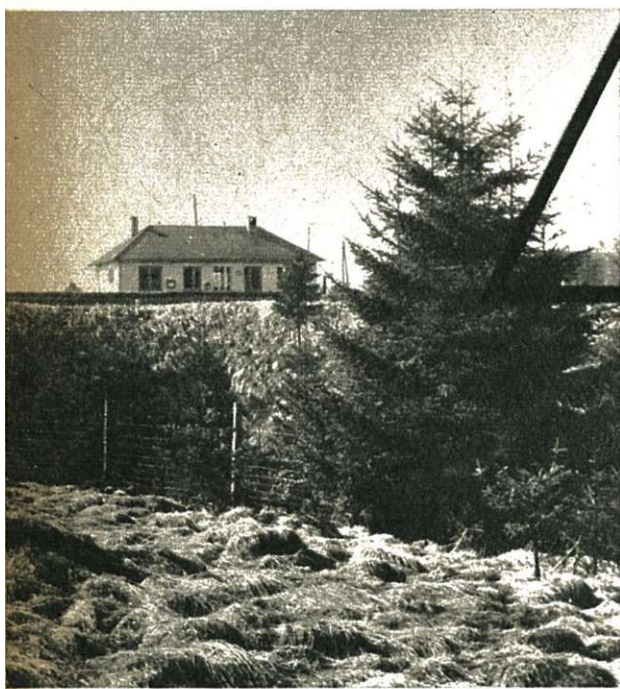
Hoogste goederenstation : Losheimergraben, op de lijn 45. Hoogtepeil van het spoor : 613 m.

Hockai wordt maar bediend door autobussen en seizoentreinen. Villeroux, op de lijn 163, is het hoogste reizigerstation van het net, dat TIJDENS ALLE SEIZOENEN geopend is. Hoogtepeil van het spoor : 533,99 m.