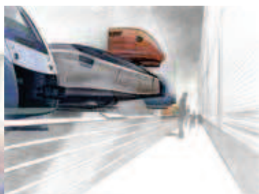
Locomotiefneuzen in dezelfde richting!