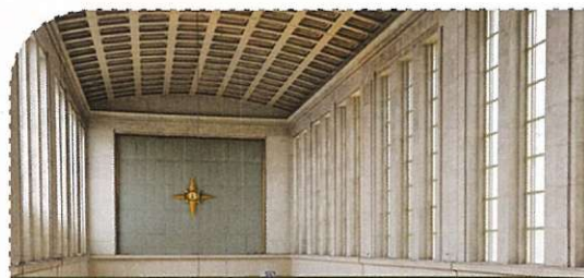
De stationshal wordt vrijgemaakt en krijgt haar monumentale uitzicht terug