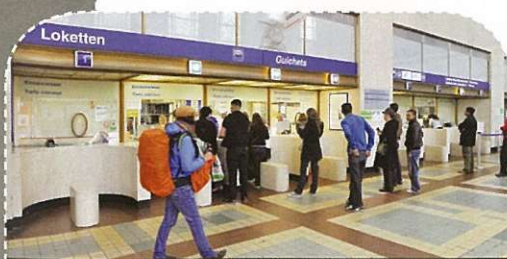
De bestaande loketten worden vervangen door een modern Travel Centre

Om de aansluiting op de andere vervoermiddelen te verbeteren, komen er in de stationshal een lift, roltrappen en vaste trappen naar het niveau -1. Daar komt een nieuwe fietsenstalling met 470 plaatsen (uitbreidbaar tot 940), het fietspunt, de standplaatsen voor taxi's en Cambio en een kiss & ride-zone. De monumentale stationshal wordt ontdaan van alle toevoegingen en obstakels en verkrijgt haar imposante uitzicht terug.