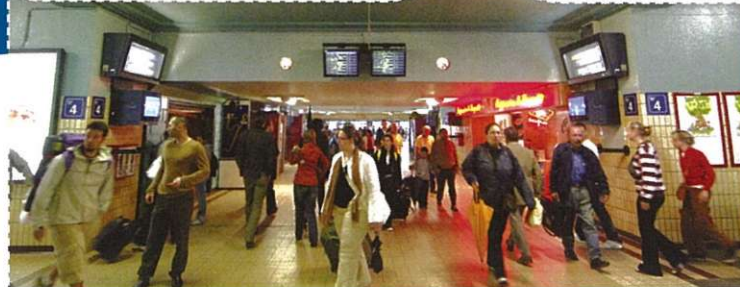
De verschillende onderdoorgangen en de winkels worden vernieuwd

Om die werken te kunnen uitvoeren, wordt een gedeelte van de onderdoorgangen en perron 1 tijdelijk afgesloten. Vanaf eind mei zullen de reizigers geen gebruik meer kunnen maken van de parking onder het station omdat die gebruikt zal worden als werfzone en omdat de ruimte in de toekomst een nieuwe bestemming zal krijgen (zie verder). De parkings uitgebaat door Interparking onder het CCN blijven wel toegankelijk.