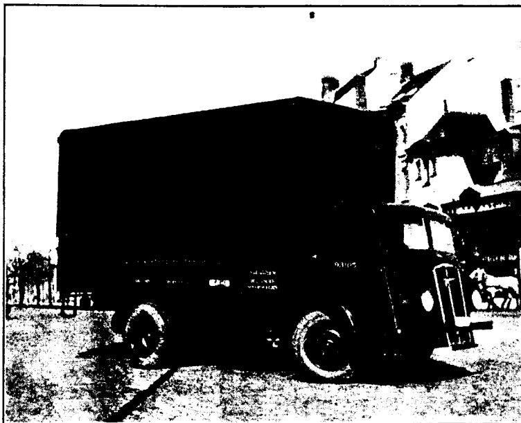
Vrachtauto F. N. 4 ton, gebruikt te Brussel voor het afhalen en bestellen van stukgoed

d) Welke ook de moeilijkheden wezen waarmede de inrichting van den besteldienst in de groote steden gepaard gaat, moet echter zooveel mogelijk rekening gehouden worden met de wenschen van de cliënteel, bij het vaststellen van het meest geschikte oogenblik voor het afhalen en bestellen der