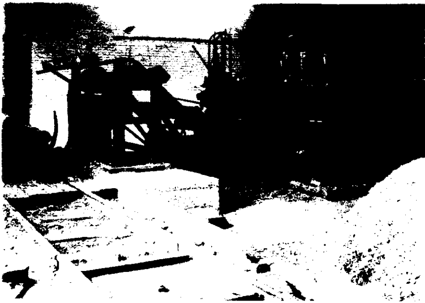
Automatische machine voor het inkepen en boren der dwarsliggers

met sleephaken, brengt de bewerkte dwarsliggers over op de zogenaamde creosoteerwagentjes. Deze wagentjes rijden op een smalspoor, dat door de autoclaven heen loopt waarin het hout aan de creosoteerbewerking wordt onderworpen.