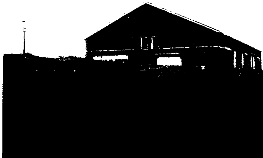
Stel creosoteerwagentjes rijdend van de kapmachines naar de persketels

Het creosoteeren wordt te Wondelgem gedaan volgens het Rupingsysteem. Dit systeem wordt ook met ledige cellen genoemd, daar het feitelijk neerkomt op een bestrijken van den binnenwand der cellen van het systeem met gevulde cellen, waarbij creosoot in het