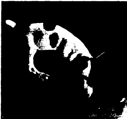
Hij ook, zoekt zijn veiligheid!

In plaats van 230 F betaalt ge 180 F in éénmaal, of 3 keer 60 F, of 6 keer 30 F.