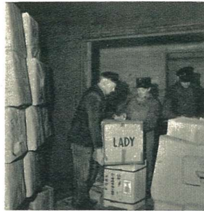
A manipuler avec douceur.