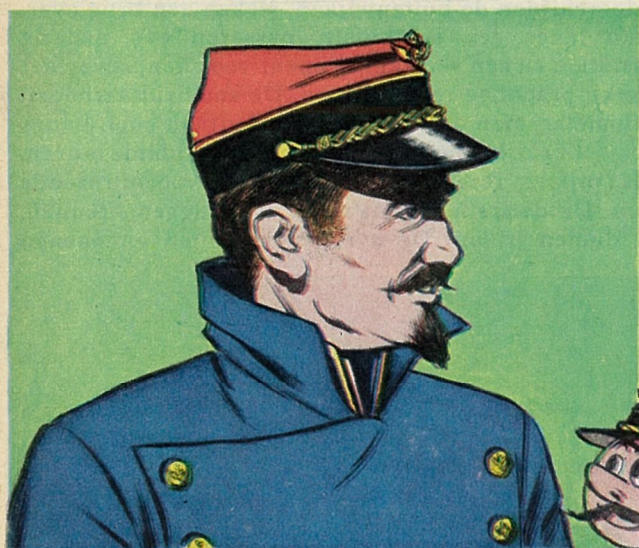
1845 : stationschef van de Belgische Staat.