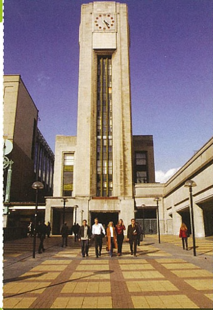
L'entrée de la rue du Progrès sera entièrement rénovée

Grâce à l'installation d'ascenseurs dans le couloir sous-voies, côté centre-ville, et à l'aménagement d'escalators dans le couloir sous-voies, côté Schaerbeek, les quais seront beaucoup plus accessibles après les travaux. L'ensemble des couloirs sous-voies deviendra donc facilement accessible pour les personnes à mobilité réduite. Les entrées de la gare, côté rue d'Aerschot, seront réaménagées et équipées d'escalators. L'accès côté centre-ville sera également équipé d'un ascenseur. Enfin, l'accès côté centre-ville (rue du Progrès) sera entièrement rénové.