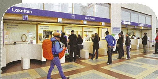
Les guichets existants seront remplacés par un Travel Centre moderne

Afin d'améliorer la connexion avec les autres moyens de transport, le hall de la gare sera équipé d'un ascenseur, de nouveaux escalators et d'un escalier fixe vers le niveau -1. C'est en effet au niveau -1, sous le hall de la gare que sera aménagé un nouveau parking pour vélos proposant 470 places (extensibles jusqu'à 940 places), un point vélo, des places de stationnement pour les taxis et les voitures Cambio ainsi qu'une zone Kiss & Ride ("Dépose-Minute"). Enfin, le hall de la gare sera libéré des multiples ajouts qui y ont été successivement installés et retrouvera ainsi son aspect monumental.