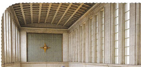
Le hall de la gare sera dégagé et retrouvera son aspect monumental