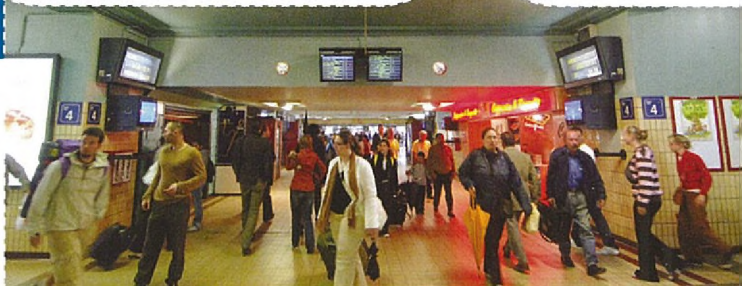
De verschillende onderdoorgangen en de winkels worden vernieuwd

Om die werken te kunnen uitvoeren, wordt een gedeelte van de onderdoorgangen en perron 1 tijdelijk afgesloten. Vanaf eind mei zullen de reizigers geen gebruik meer kunnen maken van de parking onder het station omdat die gebruikt zal worden als werfzone en omdat de ruimte in de toekomst een nieuwe bestemming zal krijgen (zie verder). De parkings uitgebaat door Interparking onder het CCN blijven wel toegankelijk.