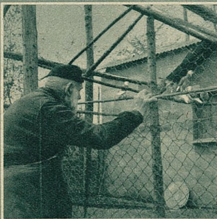
Daar het woud niet veraf ligt, worden de duiven opgesloten in hun hok.