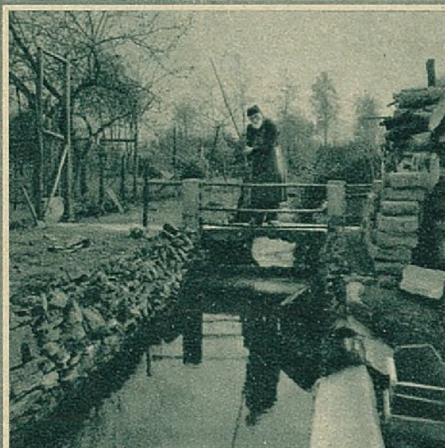
In het kleine beekje hebben de forellen geen wantrouwen. Zij kennen niets dan vrienden en slechts éénmaal in hun leven geschiedt hun kwaad...