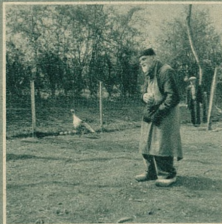
Vóór ik het park betrad, had ik me voorgesteld de eigenaar te fotograferen midden het honderdtal konijnen die in vrijheid rondlopen, maar eens binnen waren ze allen weg : zij vluchten steeds, bij het minste aanraad, in speciaal daarvoor aangelegde hutjes.