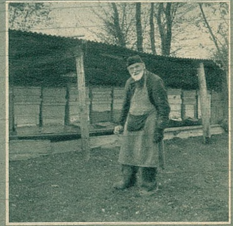
Als verwoed imker, toont hij mij eerst zijn bijenhof