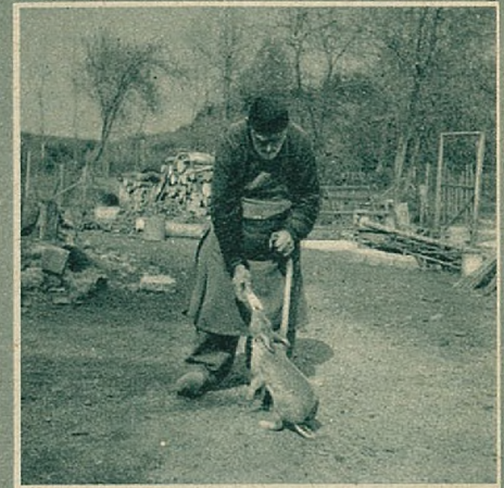
Het tomste van allen is een wild konijn dat, zonder aarzelen, aan een stuk brood komt knabbelen.