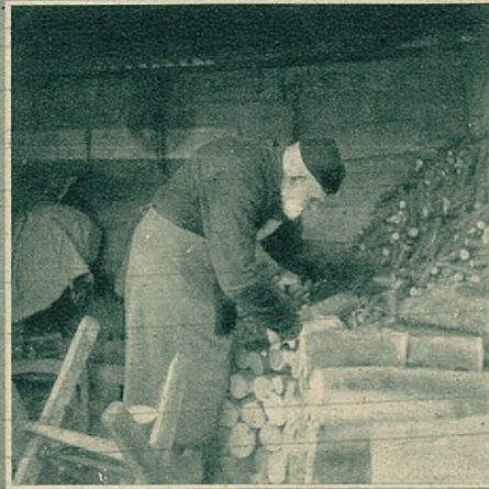
Wanneer het laatste hout geschikt is, wil hij mij wel te woord staan.