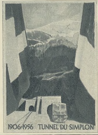
A. Holy, 1956.