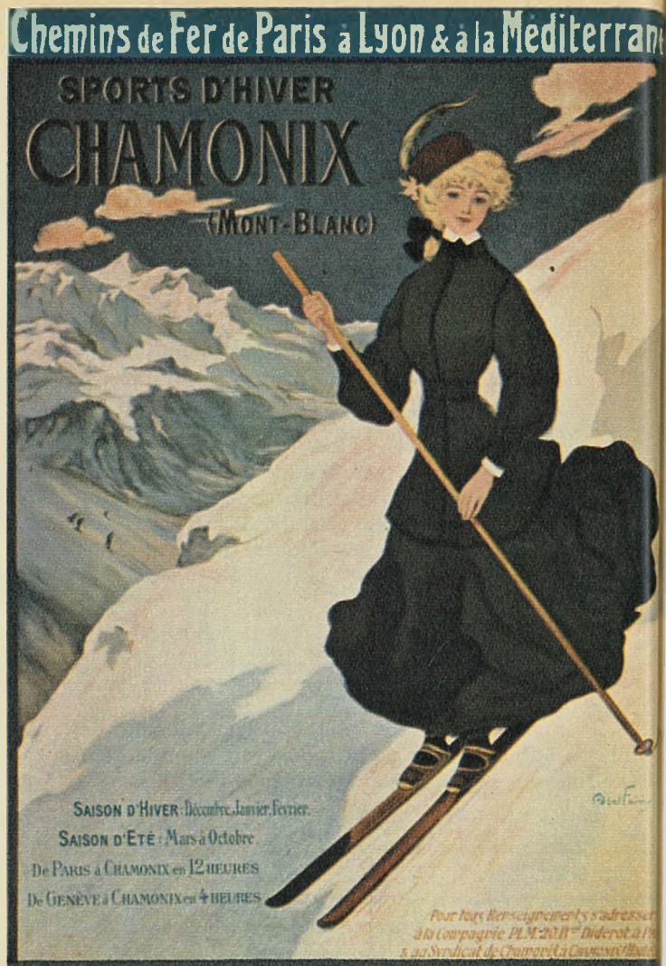
A. Fairy, 1900.

(Uittreksel uit een tekst van de Centrale voor Informatie en Publiciteit der Europese Spoorwegen, naar aanleiding van een tentoonstelling van spoorwegaffiches te Genève in juni 1967, tentoonstelling die onlangs ook in Parijs plaats had.)