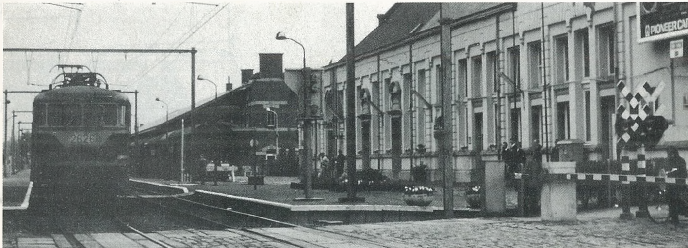
Het station van Turnhout, gekiekt vanaf de Merodelei.

De realisatie van het volledige elektrificatieproject schept thans niet alleen de mogelijkheid tot inkorten van de vroegere rittijd, maar maakt ook het vervoer per trein heel wat aantrekkelijker voor het publiek door het inzetten van meer modern en comfortable materieel. Daar bovendien de indienststelling van de geëlektrificeerde lijn op