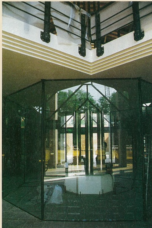
WACHTZAAL IN HET MIDDEN VAN DE HAL

Het ruimste gedeelte op de benedenverdieping is uiteraard de hal. Ze meet ongeveer 400 m 2 . In het midden komt er een verwarmde en volledig