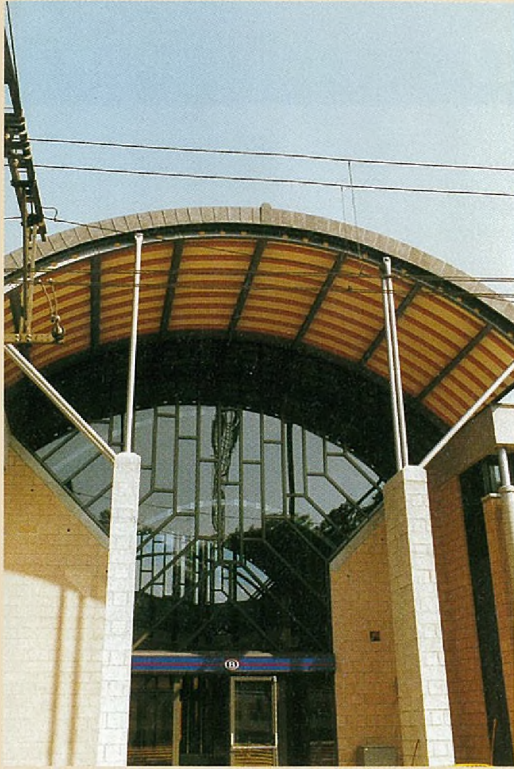
INGANG MET EEN GROOT HORIZONTAAL RAAM

publiek staan overdag onder toezicht van een toilet dame. Daarnaast komen er nog sanitaire installaties speciaal voor gehandicapten.