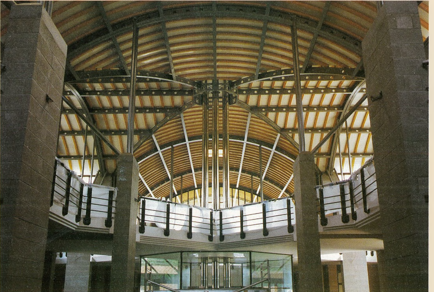
PLAFOND GEZIEN VANOP HET GELIJKVLOERS