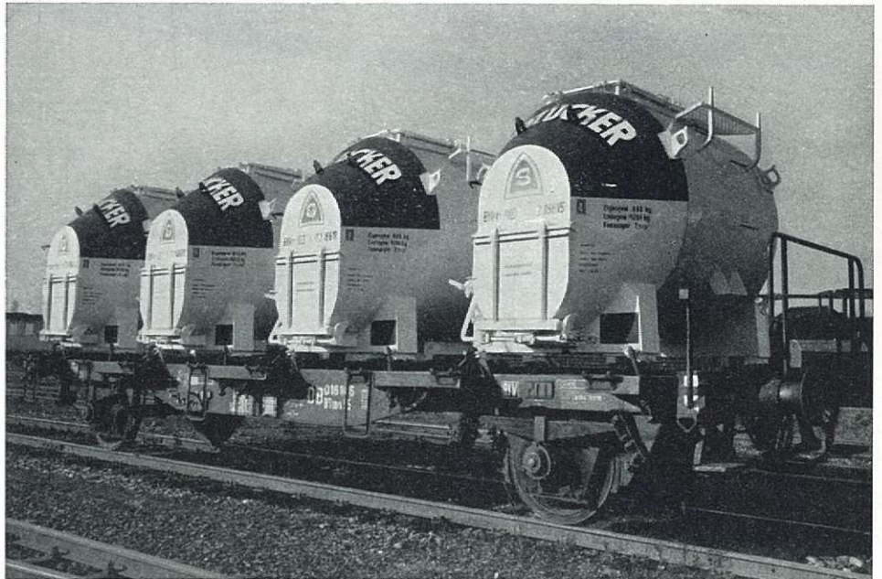
Cilindrische containers in gebruik bij de Deutsche Bundesbahn.

de draagwagen, ongeveer 3,50 m is. Op de speciale wegtractor is de totale hoogte ongeveer 3,36 m tot ongeveer 3,46 m naar gelang het type van de benuttigde tractor.