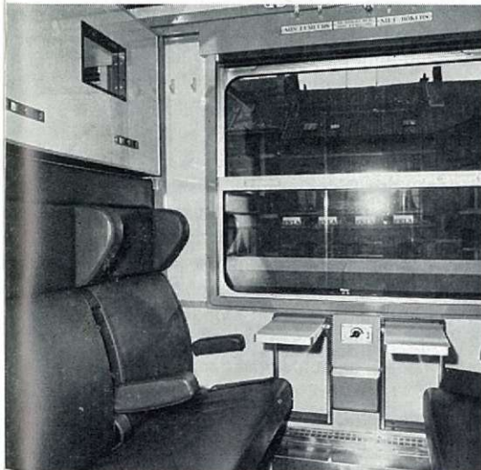
B. Interieur van een ligrijtuigafdeling 2de klasse (dagopstelling). Tussen de twee opklapbare tafeltjes bemerkt men de kruk waarmee de reizigers, naar believen de temperatuur kunnen regelen.