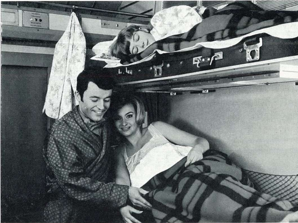
C. Interieur van een ligrijtuigafdeling 2de klasse (nachtopstelling).