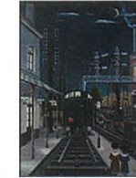
Gare la Nuit II