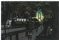
La Gare forestière