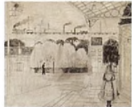
Etude pour Le Viaduc