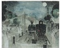
Etude pour Le Voyage légendaire