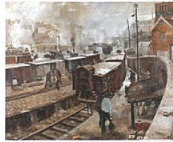
Les Cheminots de la gare du Luxembourg