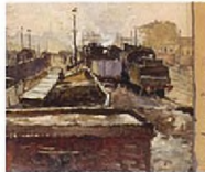
La Gare du Luxembourg