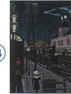
Gare la Nuit I