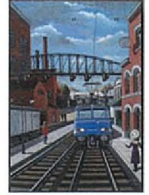
Gare de Jour II