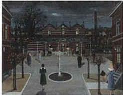
Petite Place de gare