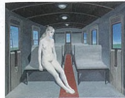
Le Dernier Wagon