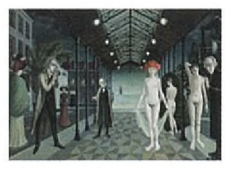
Hommage à Jules Verne