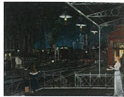
Les Trois Lampes