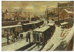
Gare du Luxembourg sous la neige