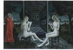
Office du Soir