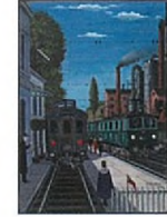
Gare de Jour I