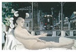
L'Âge de fer