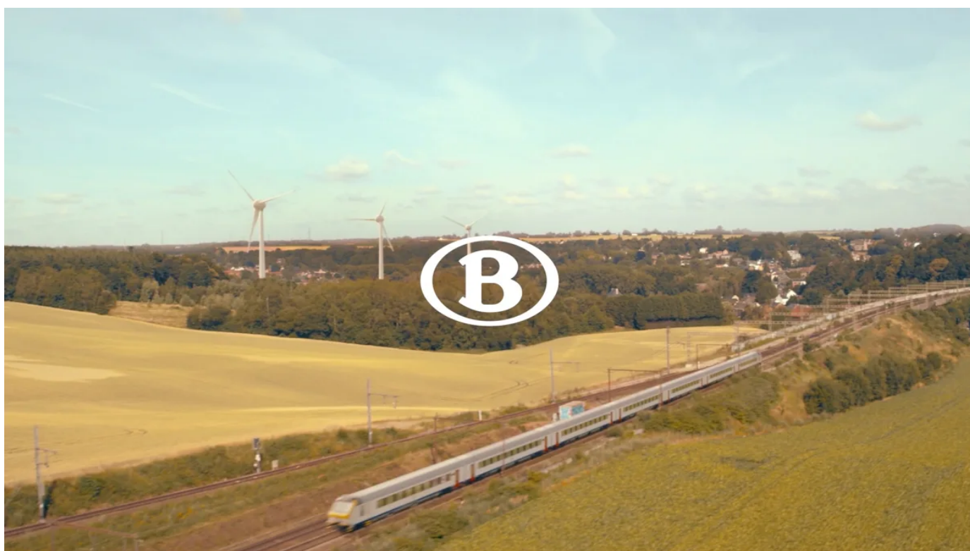
De trein stoot 7 tot 13 keer minder CO2 uit dan de automobilist

* Deze waarden houden rekening met de koolstofintensiteit van de elektriciteitsproductie in België en de 4% van de treinen van NMBS die rijden op niet geëlektrificeerde lijnen (dieselmotor).