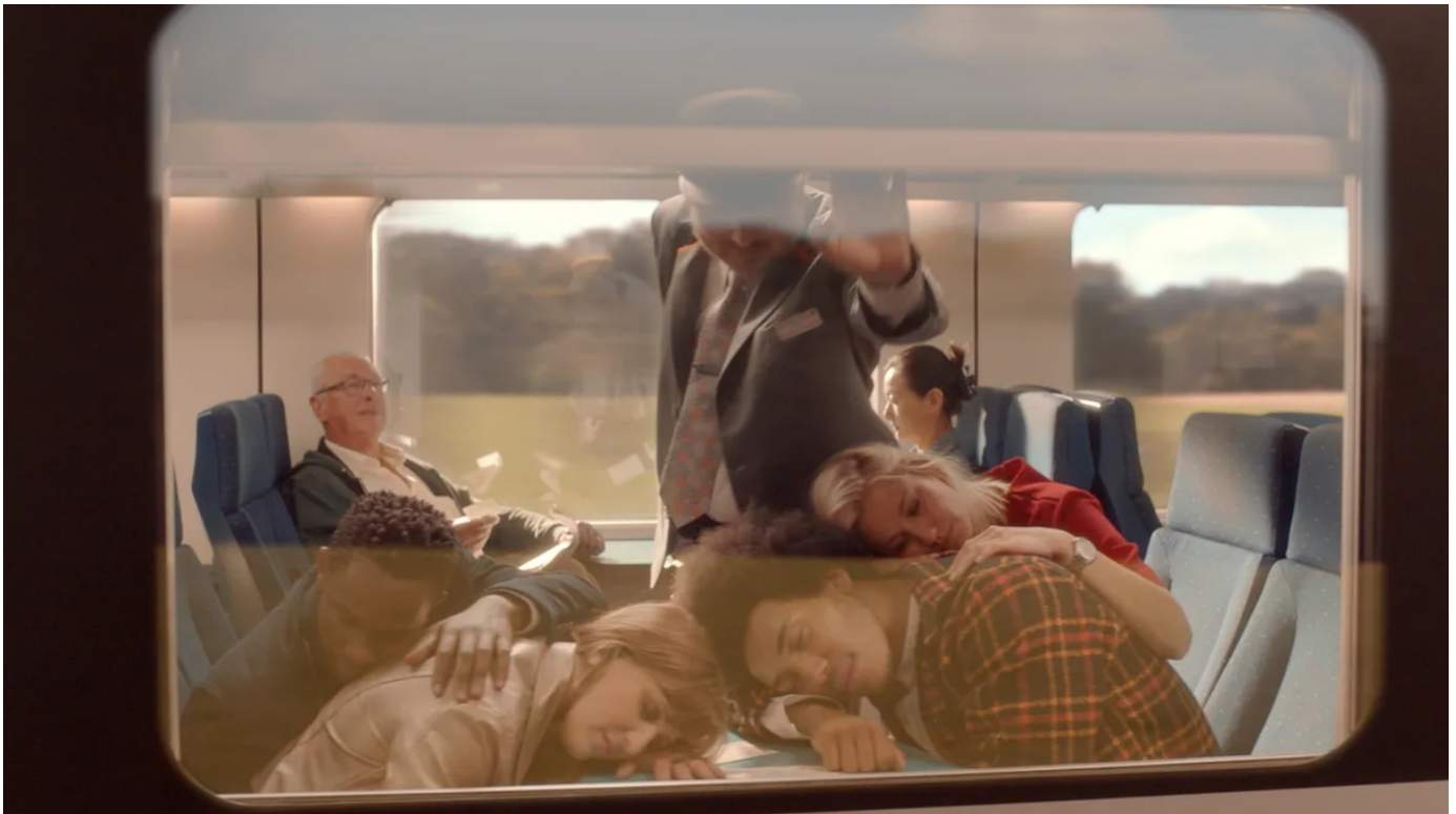
De reizigers profiteren van hun rit om zich te ontspannen, te lezen of te werken