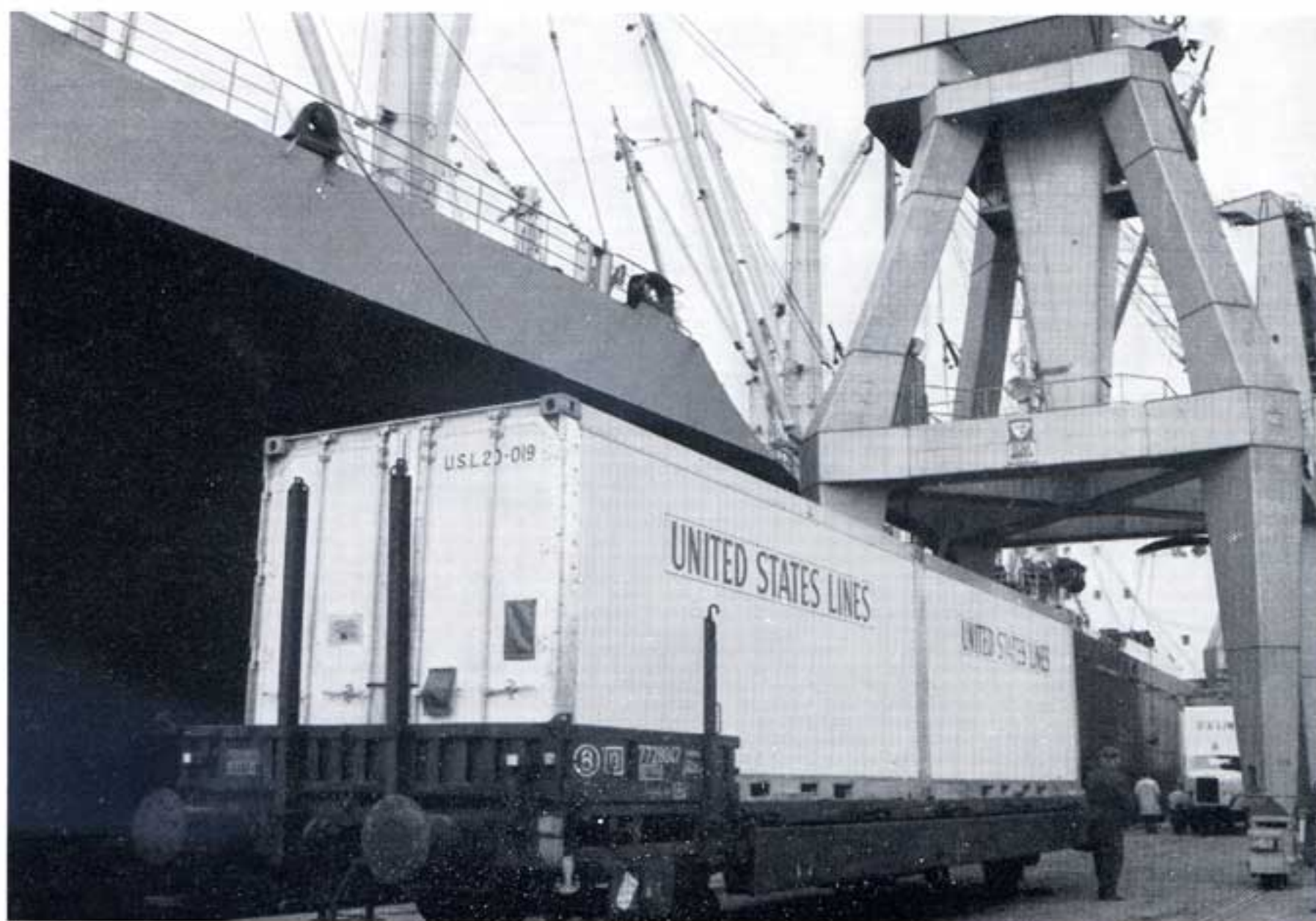
Un transcontainer, chargé sur un wagon plat, au port d'Anvers.

darse (Churchilldok) et le côté nord de la 6 me darse.