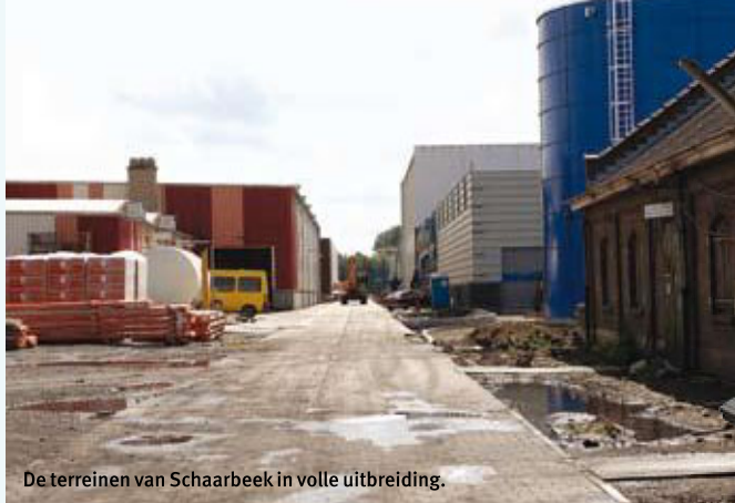
De terreinen van Schaarbeek in volle uitbreiding.