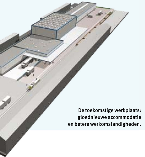
De toekomstige werkplaats: gloednieuwe accommodatie en betere werkomstandigheden.

verhuisden, zaten aanvankelijk ook met twijfels. Maar de gloednieuwe accommodatie in Schaarbeek maakt veel goed. Zoals we allemaal weten bevorderen betere werkomstandigheden automatisch de sfeer,” aldus Saerens.